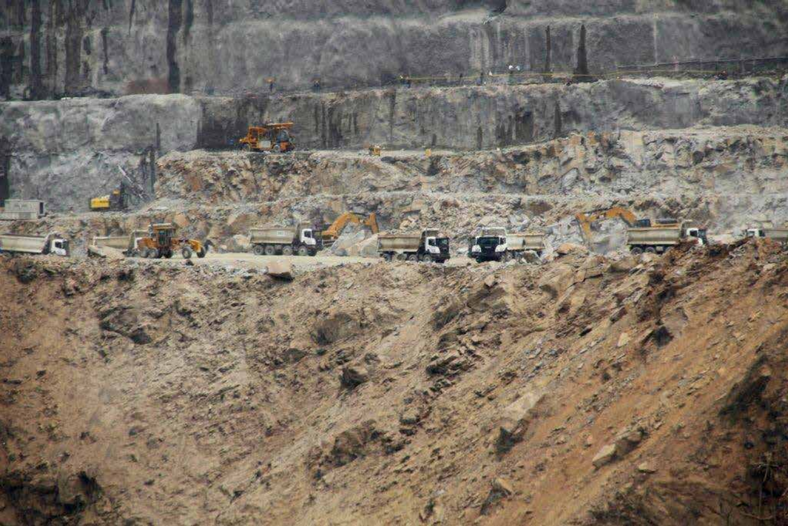
Några av de Scania lastbilar som används i bygget av vattenkraftverket.

rar insynen i projektet. Även Antioquias provinsregering som är huvudägare i EPM avböjer Swedwatches förfrågan om intervju. EPM menar att det är huvudansvarigt för projektet och därför föredrar företaget att svara på alla frågor självt. Enligt EPM har företaget inte tagit emot några klagomål vare sig på eller från de företag som ingår i konsortiet. 258 Swedwatch har bett om information om vilka andra företag som är leverantörer till projektet, men har inte fått det när rapporten trycks.