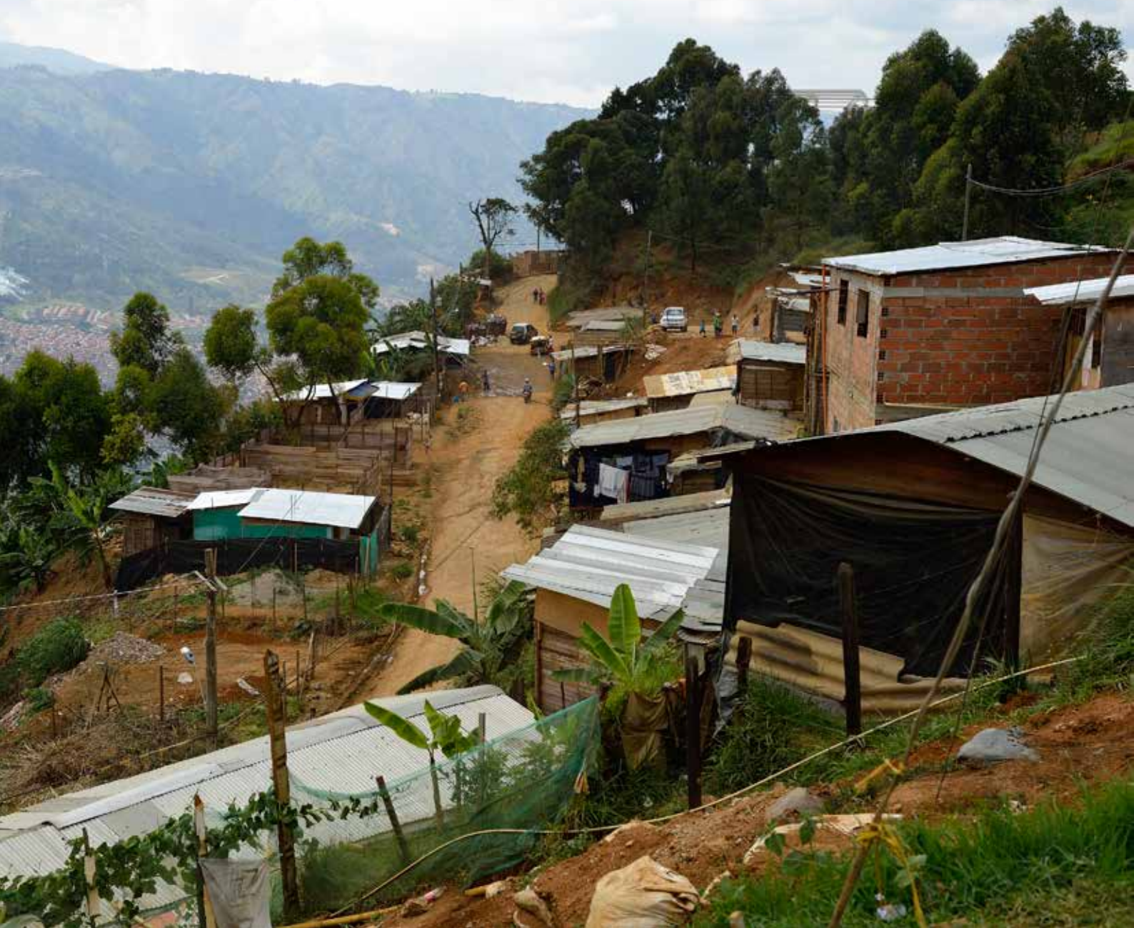
En av kåkstäderna utanför Medellín dit flera av de drabbade flytt.