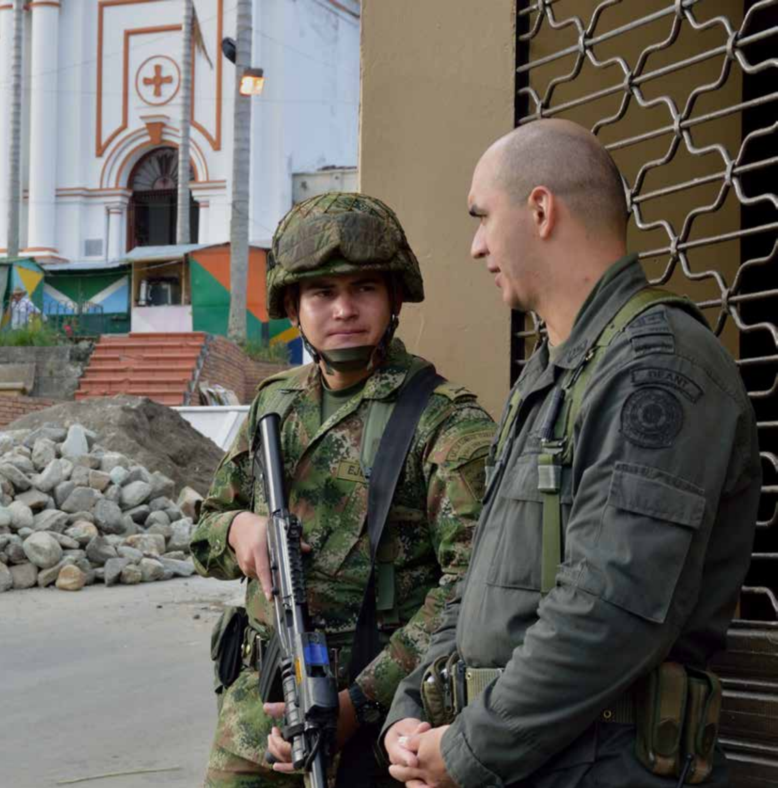
Närvaron av statlig och privat säkerhetspersonal som ska skydda vattenkraftverket har ökat i projektområdet. På bilden polis och militär i Hídroituango.