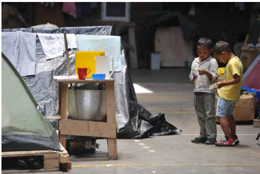
Två pojkar på idrottsanläggningen på det statliga universitetet i Medellín. Drygt 300 personer som lämnat projektområdet på grund av hot och förlorade försörjningsmöjligheter bodde i idrottsanläggningen i drygt sex månader under 2013.

I mars 2013 bestämde sig runt 370 drabbade personer från Hidroituangos projektområde som anslutit sig till Ríos Vívos att gemensamt lämna området. De ansåg att situationen blivit ohållbar. Hoten mot dem hade ökat från flera håll och bristen på försörjningsmöjligheter hade blivit akut för dem som varit beroende av den traditionella guldvaskningen. Gemensamt tog de sig till Medellín där de genomförde flera protester som uppmärksammades i lokala medier. 157 I väntan på hjälp från myndigheterna ockuperade de en gammal idrottsanläggning på det statliga universitetet, Universidad de Antioquia , i Medellín.