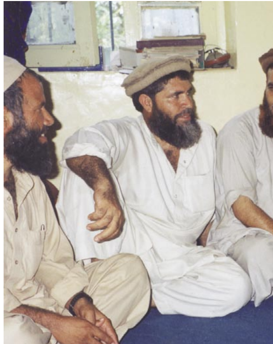
Ett traditionellt byråd i byn Kirharah i Kunarprovinsen.

Utöver lagen om skydd eller fristad finns också en tradition av nanawati , vilket innebär att be om förlåtelse för ett brott som begåtts av någon annan,