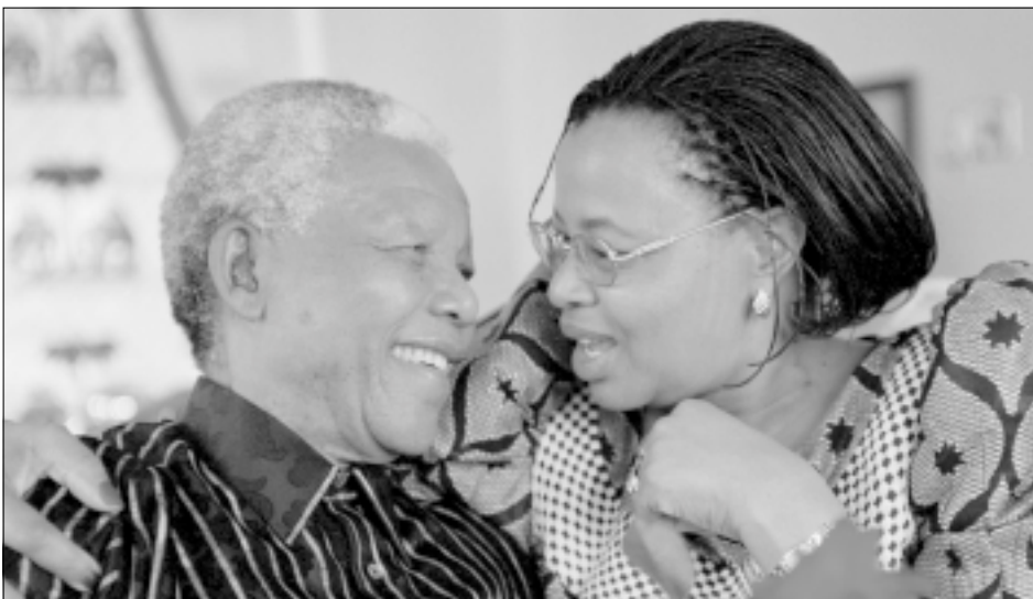
Det äkta paret Nelson Mandela och Graça Machel är nominerade till Världens barns pris, Mandela för sin livslånga kamp för att befria Sydafrikas barn från apartheid och Machel för sin långa och modiga kamp för barns rättigheter, främst i Moçambique