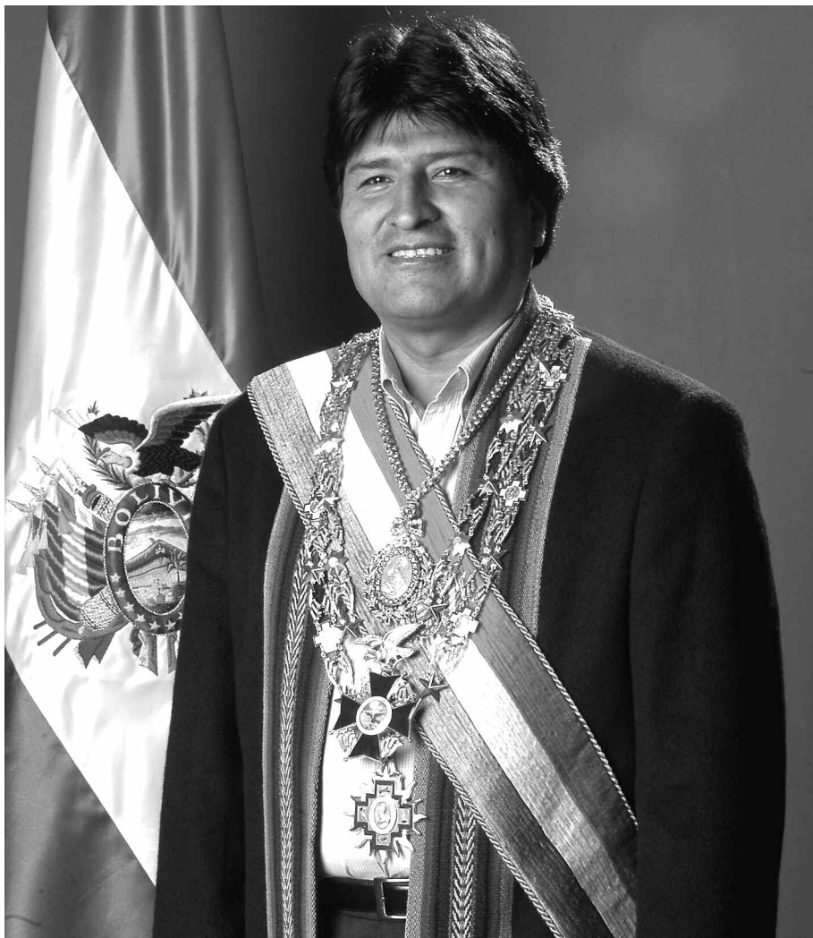
"Evo Morales stöd kommer från gruvarbetarna i COB, det bolivianska LO, från småbönderna, från studenternas och många av det civila samhällets organisationer."

Kongressen utropar nu, den 20 april 2005, vicepresidenten Alfredo Palacio till ny president. "Väck, väck, bort med varenda en" skan-