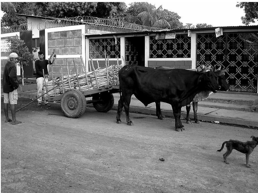
Den dagliga kampen täcker bara en knapp överlevnad och man kan inte ge sina barn mat, trygghet, skolgång och framtid.

Samtidigt ser man överklassen vältra sig i lyx.