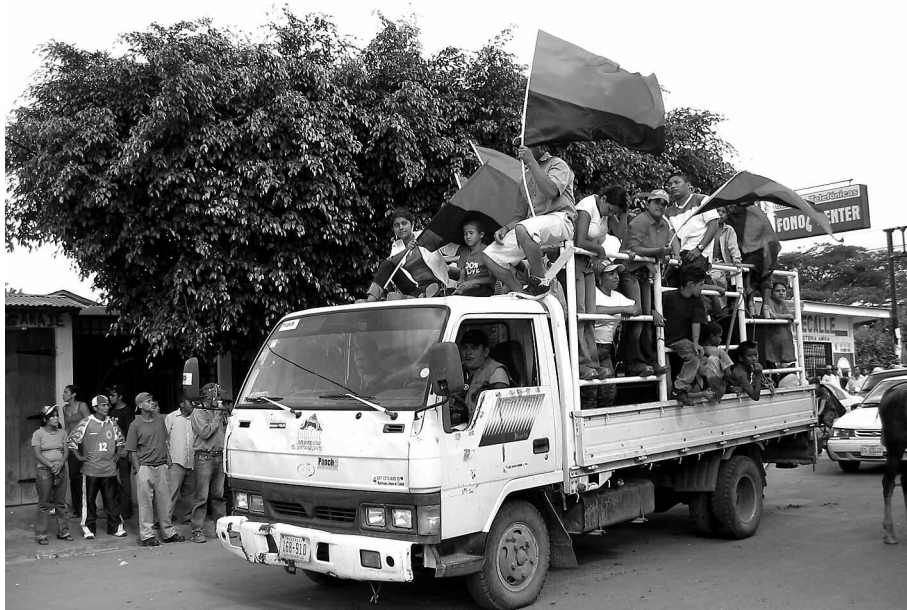
"Daniel Ortega är av folket och är den enda som kan försvara dess intressen."