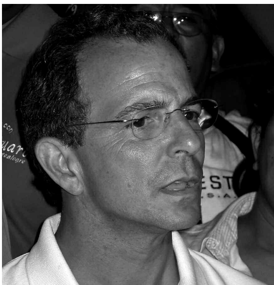
Eduardo Montealegre är presidentkandidat för Alianza Liberal Nicaragüense-Partido Conservado (ALN-PC), den avgående presidenten Bolaños parti.

– Det är en medborgerlig plikt! Och dessutom tror jag på demokratin och att befolkningen bör delta åtminstone med att rösta.