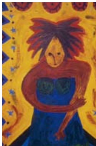
Afrikagruppernas kalender kan beställas på 08-442 70 60 eller post@afrikagrupperna.se