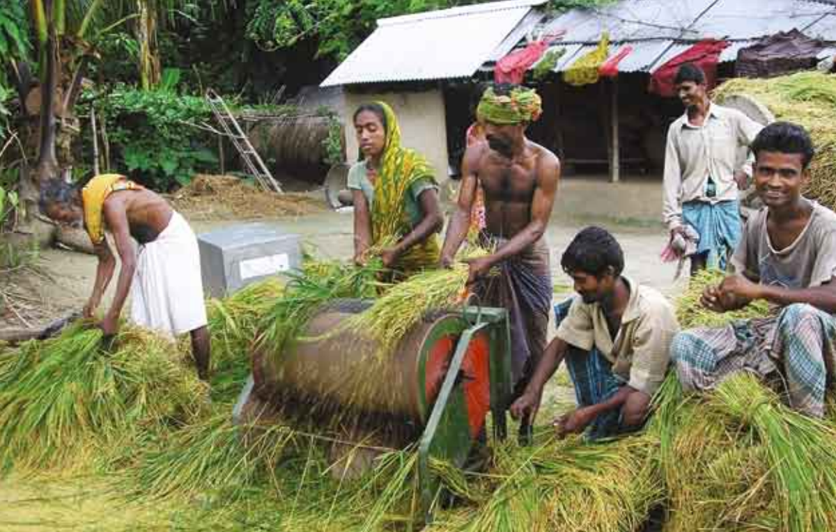
Utan böndernas medverkan och motstånd så kommer de multinationella företagen dominera helt.

UPOV (Union for Protection of New Variety of Plant) samt TRIPS (Trade Related Aspects of Intellectual Property) är de två huvudsakliga handelsavtal som möjliggör för multinationella företag att monopolisera utsädesmarknaden. UPOV säkrar absolut ägandeskap till kommersiella utsädesproducenter och utesluter odlare inom offentliga forskningsinstitutioner och bönder från möjligheten att delta i produktionen av utsäde.