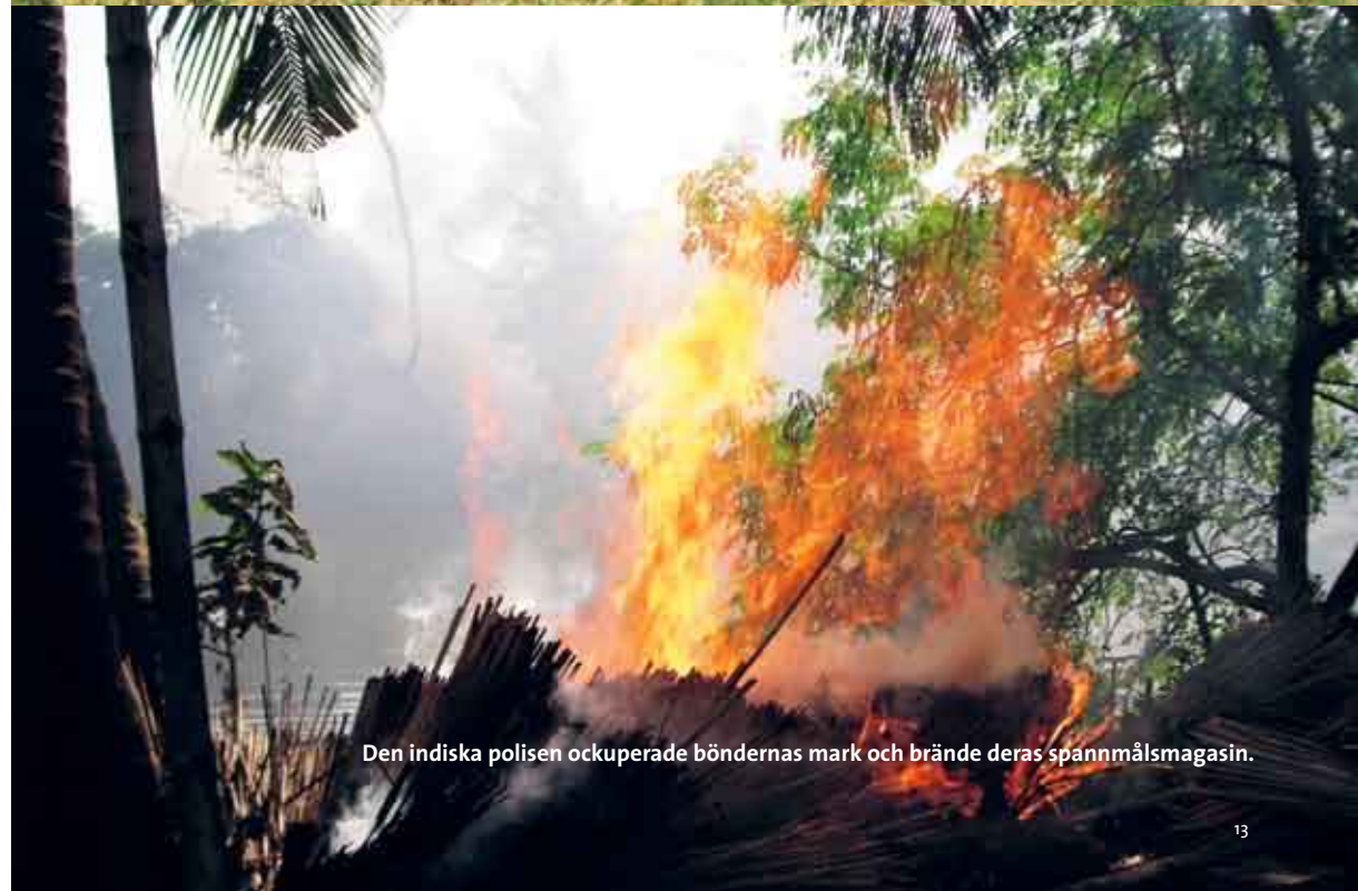
Den indiska polisen ockuperade böndernas mark och brände deras spannmålmagasin.