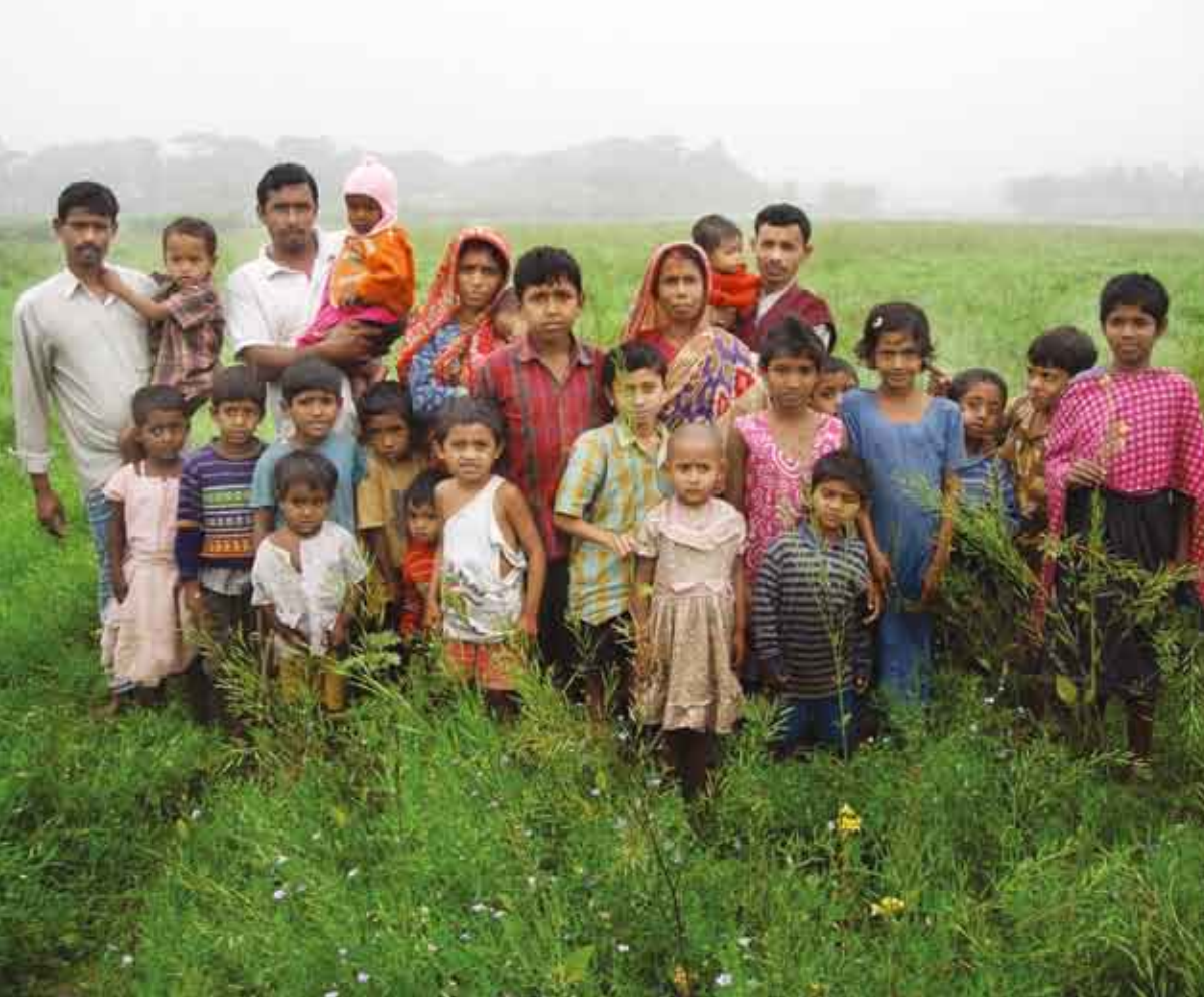
Intresset för ekologisk odling växer bland småskaliga jordbrukare.

eller ökat kraftigt i pris. Kvinnor är de som drabbas hårdast av näringsbrist då de enligt tradition äter sist i familjen.