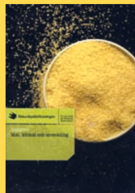
Mat, klimat och utveckling av Naturskyddsföreningen