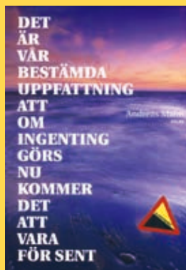
Det är vår bestämda... av Andreas Malm

* Dessa organisationer stod bakom protesterna: CIDOB (organiserar ursprungsfolk i Bolivias lågland, CSUTB (lantarbetarnas fackförbund) CONAMAQ (organiserar ursprungsfolk på höglandet, CSCB (organiserar inflyttade till Chapare och Santa Cruz), kvinnoorganisationen FMCBBS.