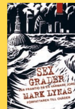
Sex grader av Mark Lynas