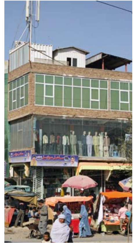
Lycee Marijan, Khair Khana.

Därför kändes det så fantastiskt åren 2003-2004, när jag bodde i Kabul och såg hur hus började sticka upp i ruinlandskapet i söder. Staden stretade emot. Den började återuppstå.