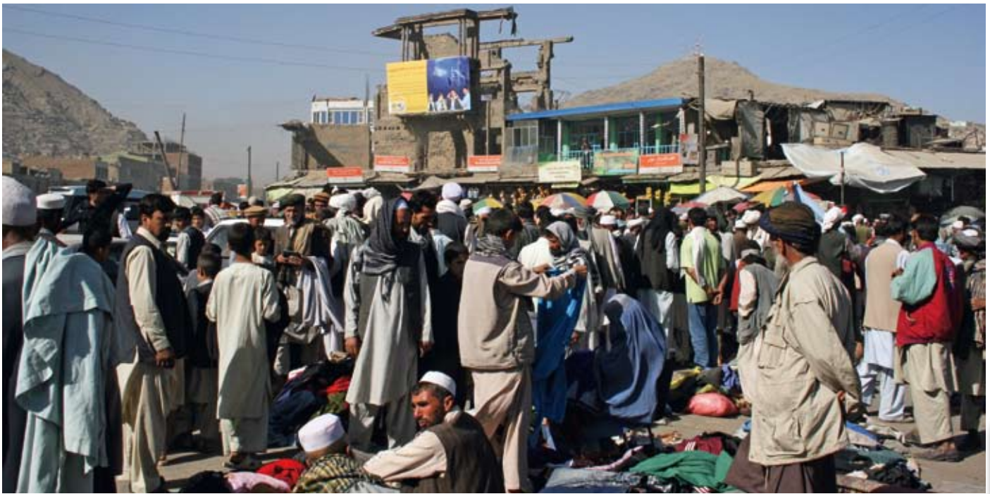
Det Kabul som byggts upp och brett ut sig är delvis väldigt olikt det gamla Kabul men på vissa platser är allt precis som det var förr.