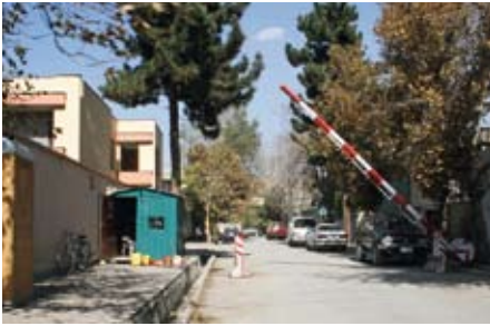
Wazir Akbar Khan.