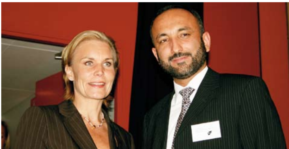
Gunilla Carlsson och Afghanistan utrikesminister Haneef Atmar.

Dr Abdullah menade att säkerheten är den största utmaningen. Ett annat problem är folkets deltagande i demokratiprocessen. De är inte nöjda med sina representanter.