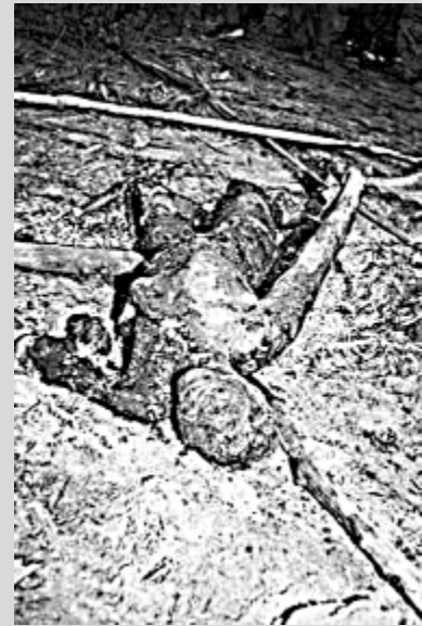
Lemlästad och bränd kvinna.