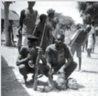
Krigare med pygméoffrenas avhuggna huvuden.