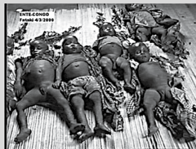
Barn som dödats i kriget.

alition bildats mellan UPC ledd av Thomas Lubanga, MLC med J P Bemba i spetsen och RDC/National under Roger Lumbala. De tre arméerna har igångsatt operation "sudda tavlan", det vill säga utplåna allt tills målet är nått att besegra och plundra städerna Mambasa och Butembo. I samma stund som J P Bemba och Roger Lumbalas trupper avancerade mot Beni (medan de dödade och åt pygméer) närmade sig Thomas Lubangas män också Beni, men från ett annat håll – Komanda-Oicha genom Mont Hoyo. Pygméerna som bodde där blev uppätta, massakrerades eller flydde till Oichia och Beni.