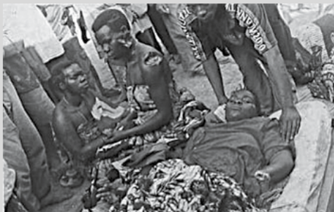
Bilden talar för sig själv.