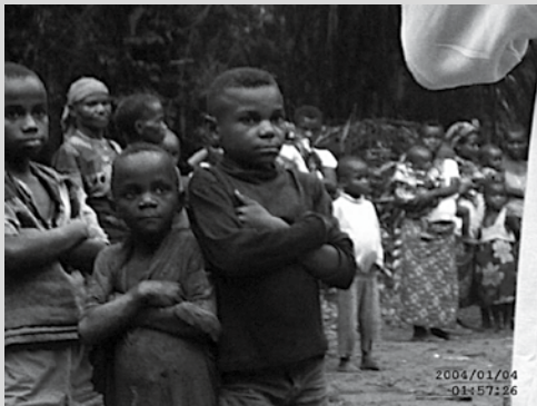
Barn som är offer för kriget.