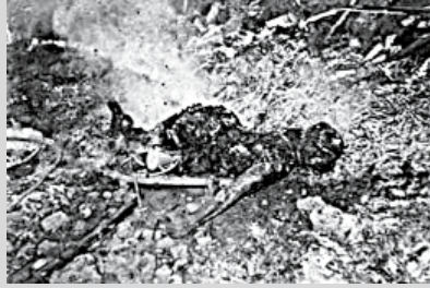
Kvinna som blivit bränd till döds.