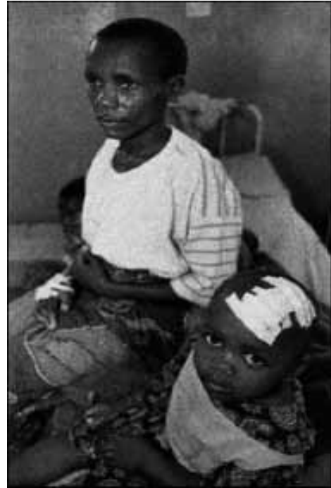
Kvinna som blivit våldtagen. Fem av hennes familjemedlemmar har massakrerats och blivit uppåtta av militären.

I jordbruksområdena i provinsen Kivu i Kongo utgör ursprungsbefolkningen pygméerna en speciell minoritet, liksom i övriga Centralafrika. Pygméerna är jägare och samlare. Det som för övrigt utmärker dem är att de är småväxta, kortare än 1,50 meter, vilket är en följd av klimatet, boplatsen och den tillgängliga födan. De hårda livsvillkoren reducerar deras förväntade medellivslängd till cirka 30 år.