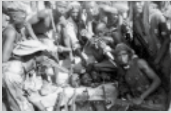
Krigare med pygméoffrenas avhuggna huvuden.