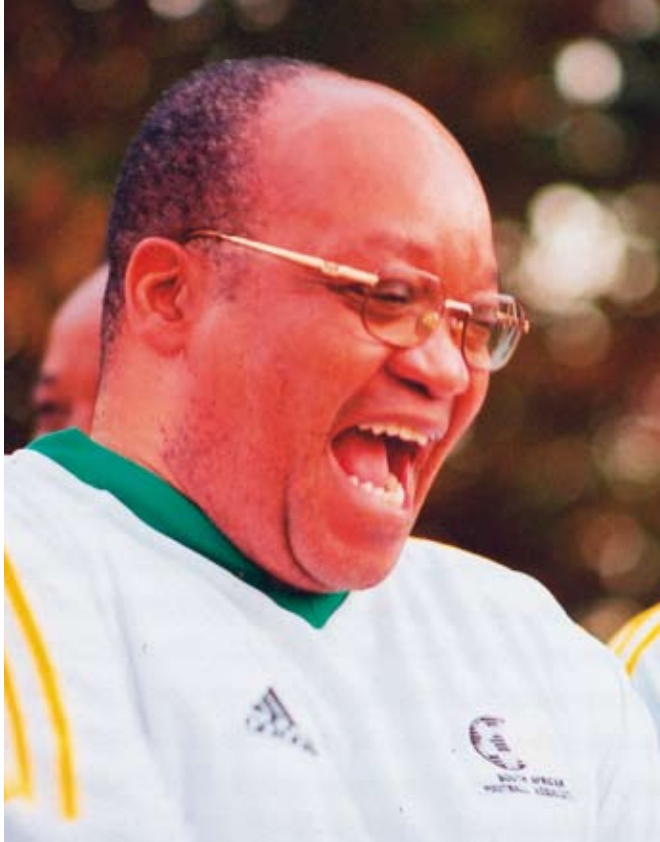
ANC:s nya ordförande Jacob Zuma kommer åter att ställas inför rätta för korruption.