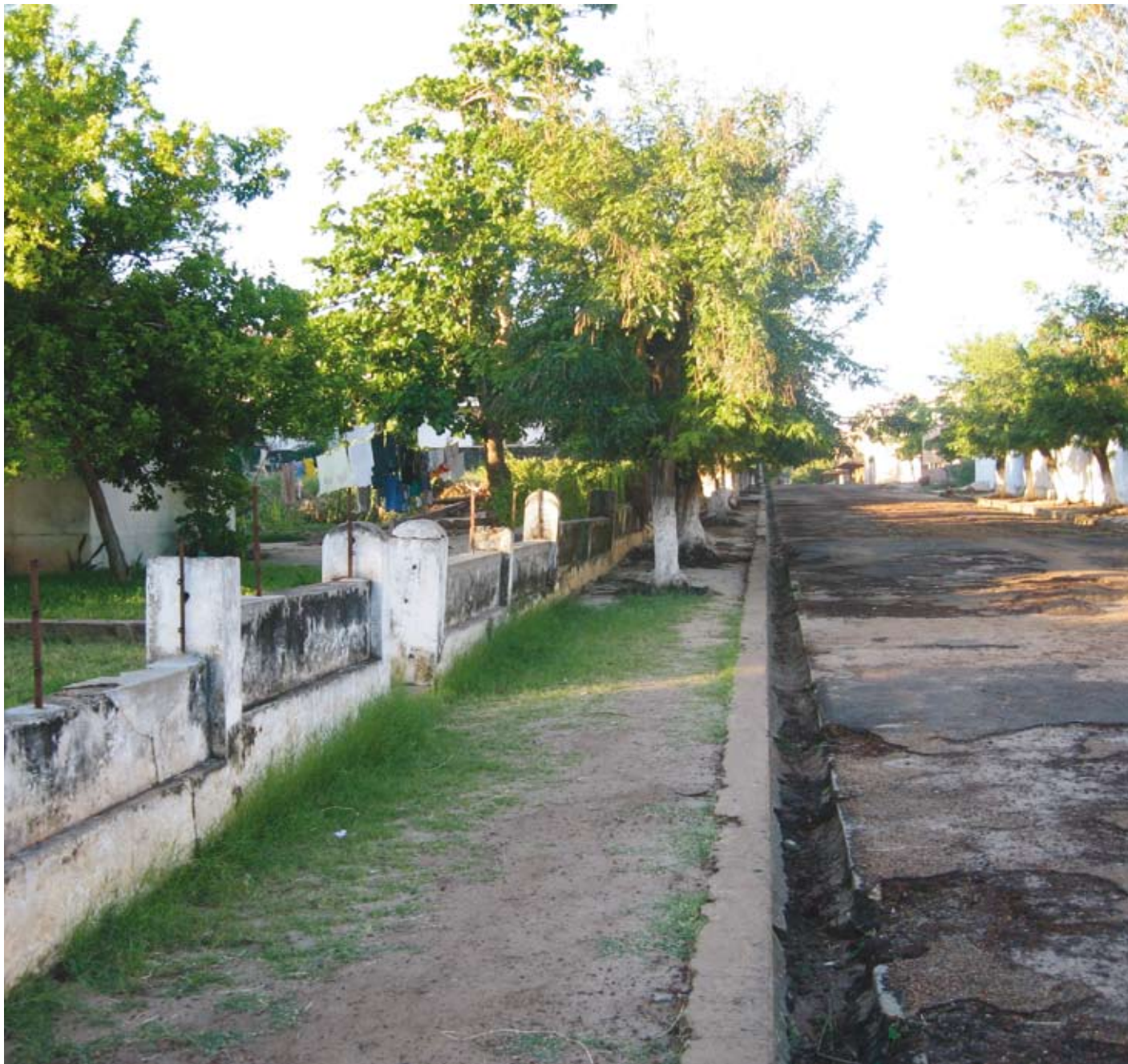
Angoche är en stillsam och fattig ort, utan framtid, menar en del invånare.