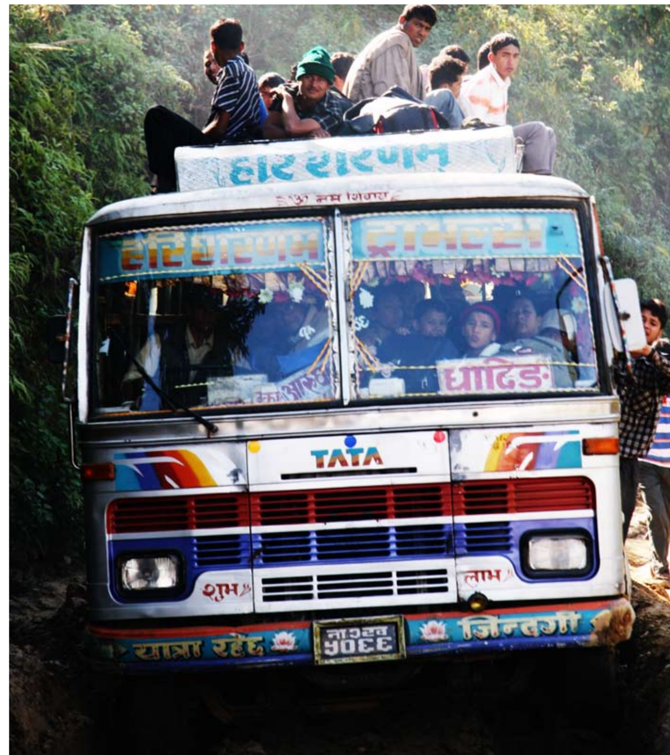
Bättre och billigare än berg- och dalbana – bussen till Jyamrong.

På bara tre-fyra årtionden har stan och den skålformade dalen expanderat från 500 000 invånare till ett storstadsområde ►