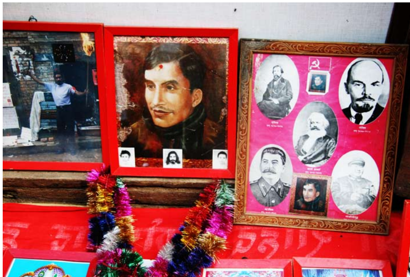
Från Vishnu till Marx och Lenin. Filosofisk evolutionslära i Kathmandus systerstad Bhaktapur.

olika ansikten, språk och tideräkningar. Alla indelade och rangordnade efter kastväsende. En rangordning som här i Jyamrong bara spänner från mindre fattig till mycket fattig, men som ändå stoppar in folk och familjer i en brant social stege. Från Rams familjs jordägande braminer till daliter; de lägstastiga grupperna som förser de högkastiga med verktyg, kläder och kroppsarbete i utbyte mot en viss andel av skörden, ibland också kött.