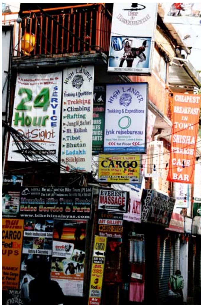
Turisterna Thamel, en stadsdel med västerländska frestelser.

som påstås rymma fyra, fem, kanske sex miljoner invånare, inklusive hundratusentals flyktingar från det nyligen avslutade inbördeskriget mellan armé och maoistgerilla.