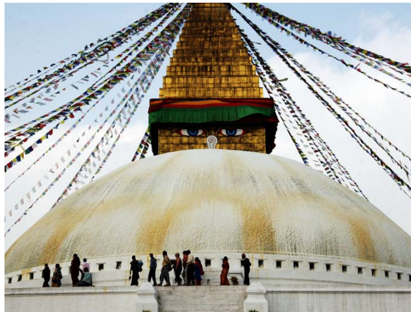
Det buddistiska Bodnath utanför Kathmandu, världens största stupa.

Håller mig fast i bussätet till rusande motorer. Förbi värdshus