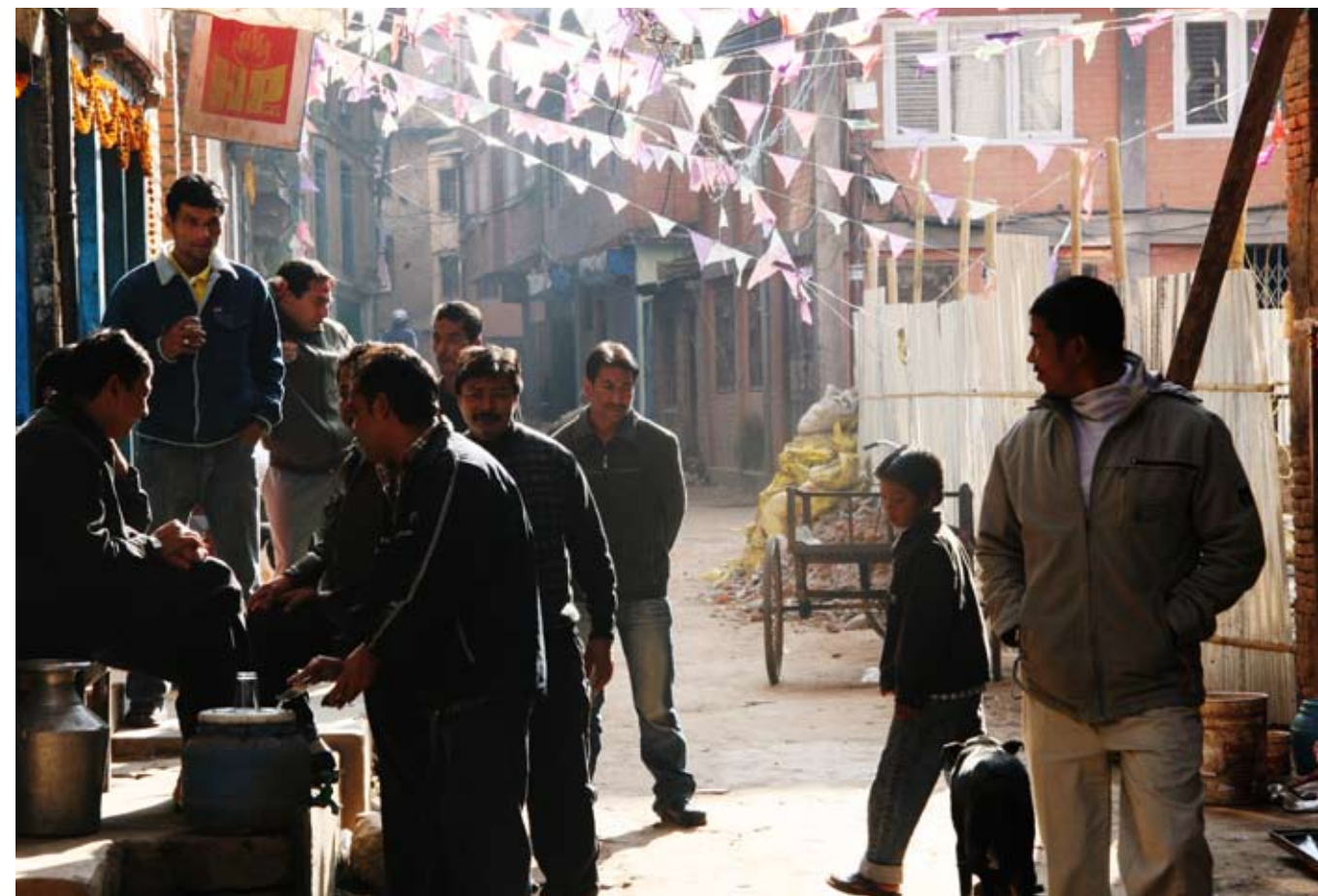
Även i Kathmandu kan medeltiden bo granne med 2000-talet...