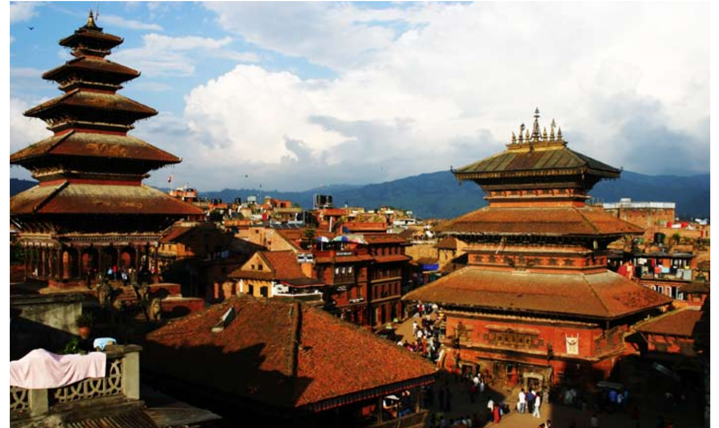
Mallaepokens tempel i Bhaktapur.