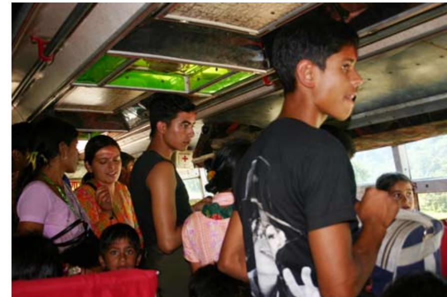
Det finns alltid plats för en till. Bussresa i Nepal.