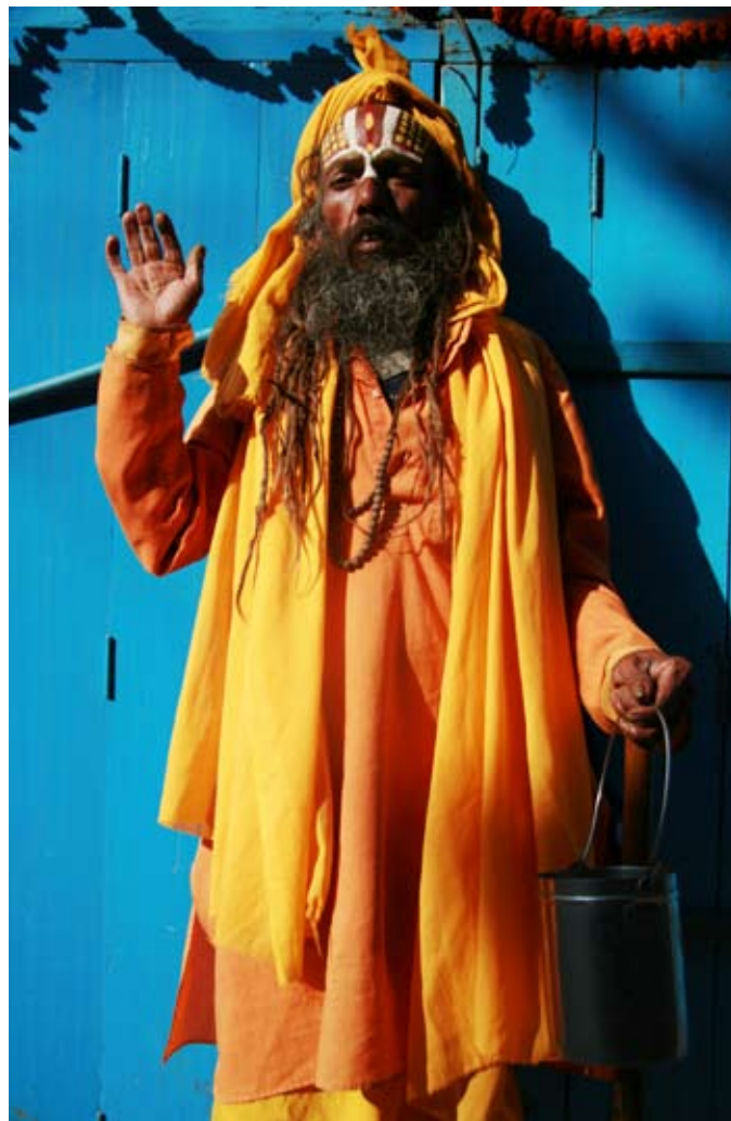
En av Jyamrongs många ansikten.

PÅ BUSSTAKEN FINNS DELAR AV Kathmandus välstånd fastsurrat. Flätade korgar, paket och lådor. Varor och presenter som är på väg till lerhusbyarna där gästarbetarna föddes, har föräldrar, släkt och kanske även fru och barn; familjer som bara återförenas