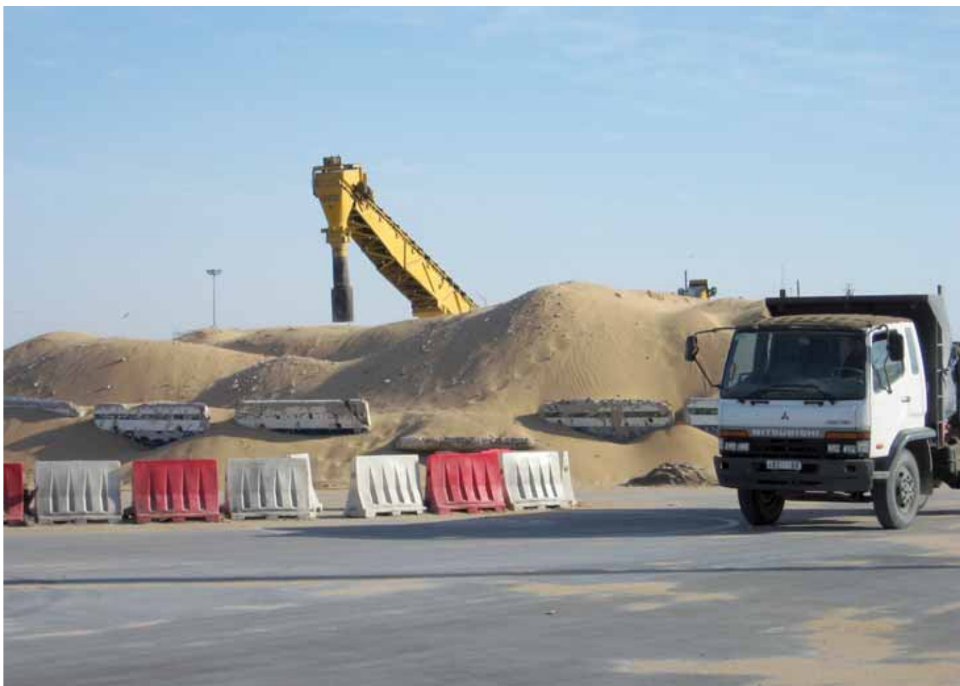
Cirka 500 000 ton sand säljs varje år av den marockanska ockupationsmakten till bland annat Madeira. Hamnen i El Aaiún.