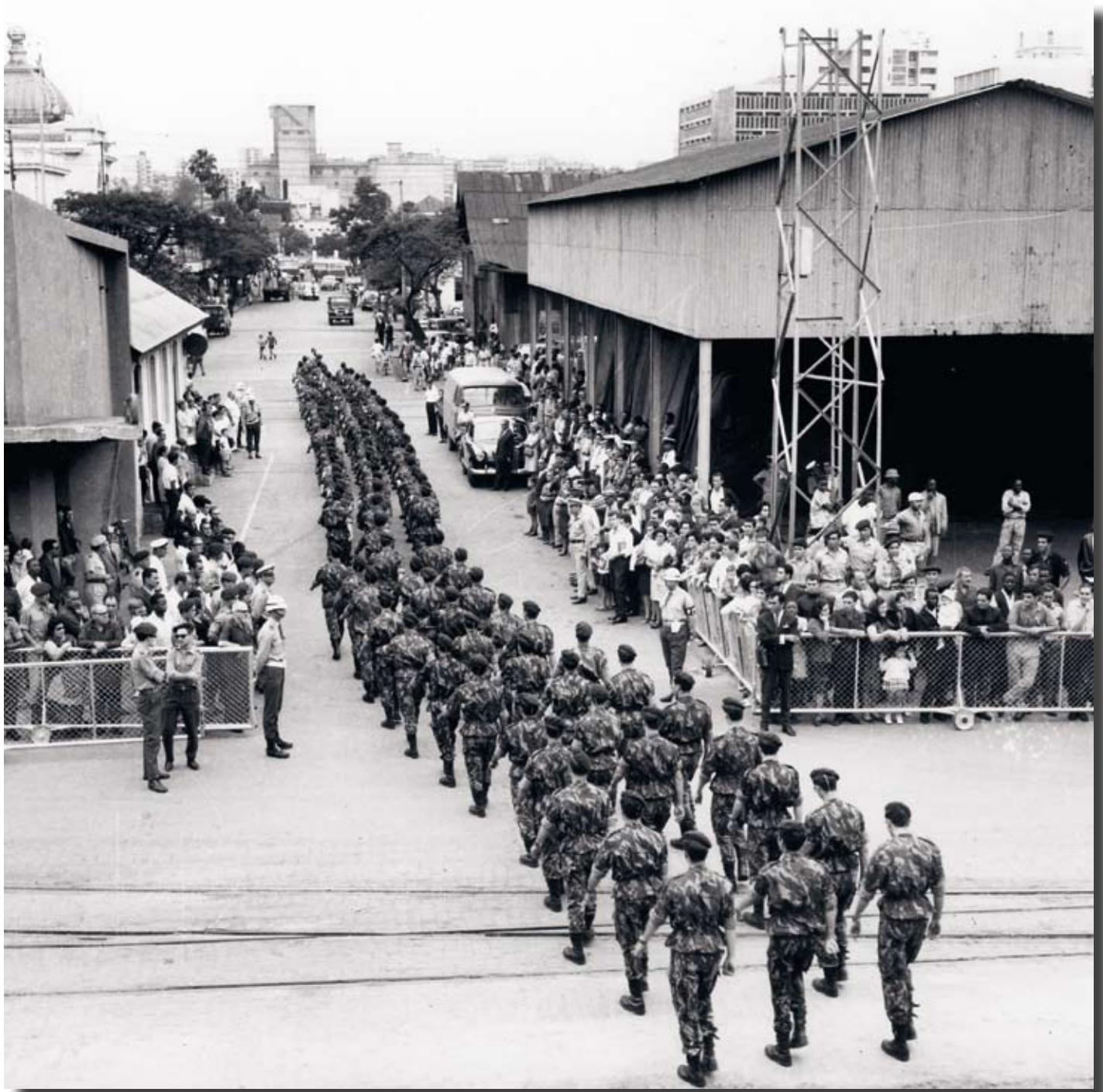
När andra kolonialmakter avvecklade sände Portugal istället fler soldater till Moçambique.