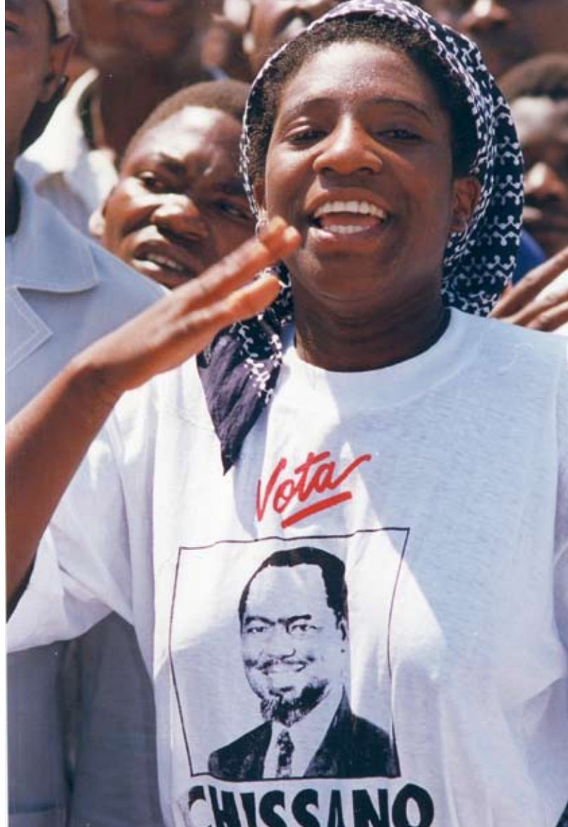
Frelimo vinner varje val, vare sig presidentkandidaten heter Joaquim Chissano, som här 1994 eller Armando Guebuza år 2004.

– MEN EFTER SAMORAS DÖD UPPTÄCKTE JAG att ledare ofta bara vill berika sig själva. Samora Machel var ett undantag men normalt kan inte nationer bero på endast en person. Le-