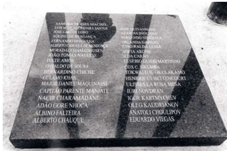
1986 omkom Moçambiques förste president Samora Machel i en mystisk flygolycka i Sydafrika. En minnessten visar namnen på dem som var ombord på planet.

Frelimo behöll regeringsmakten med Chissano som president. En låt gå-politik inleddes som fick följder för den ideologiska moralen, det var plötsligt okej att vara snuskigt rik och det spelade ingen roll hur man skaffat pengarna.