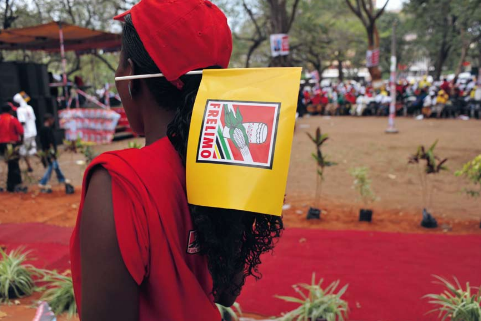
Frelimopartiet och sittande president Armando Guebuza fick 75 procent av rösterna i valet i Moçambique.

med bläck från fingret. Tyvärr blandas alla valsedlar samman när de kommer till CNE vilket betyder att det är omöjligt att spåra de skyldiga. Hade rösterna från olika inlämningslokaler hållits åtskilda vore det relativt enkelt att med fingeravtryck avgöra vem som saboterat rösterna. Utan kontroll lönar det sig att försöka fuska. Går det så går det och ifall det upptäcks blir det ändå inget straff.