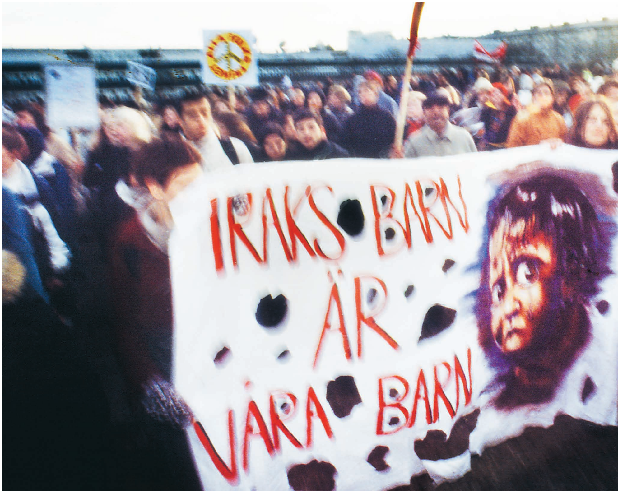
15 februari 2003. Demonstrationstågen mot USA:s föreliggande Irakattack får rekordstor uppslutning. När kriget väl bryter ut, ett par månader senare, minskar protesterna till en bråkdel.