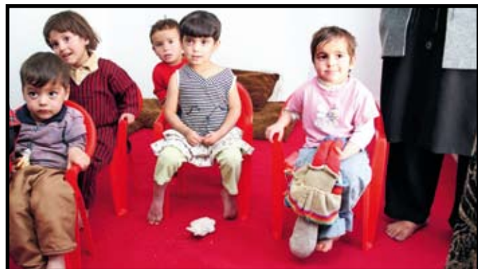
På skolans dagis går för närvarande 15 barn.

År 2002 fanns det 467 barnmorskor i hela Afghanistan. Antalet har sedan dess ökat, 2008 fanns det 2 100 barnmorskor i landet. Världshälsoorganisationen (WHO) har sagt att detta antal minst måste fördubblas för att täcka