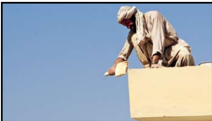
En av skolans anställda renoverar taket.

också hand om barnet. Föräldrarna var så nöjda och glada att de gav den nyfödda flickan barnmorskans namn. Barnmorskans pappa var också väldigt stolt och talade om för hela byn vad som hänt och det i sin tur inspirerade andra kvinnor att använda sig av hennes färdigheter som barnmorska.