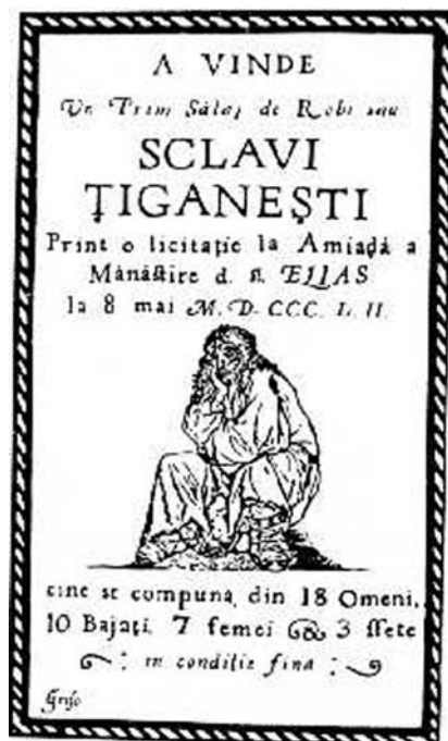
Rumänsk-språkig affisch som annonserar för försäljning av romska slavar. Bukarest, 1852

The Patrin Web Journal: A Brief History of the Roma , se nätet.