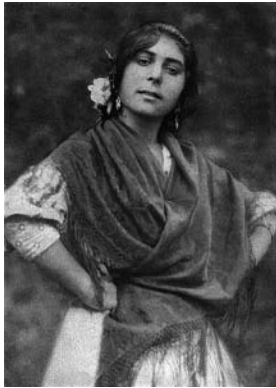
Spansk romsk flicka i Granada. Bild: Austin A Breed 1917