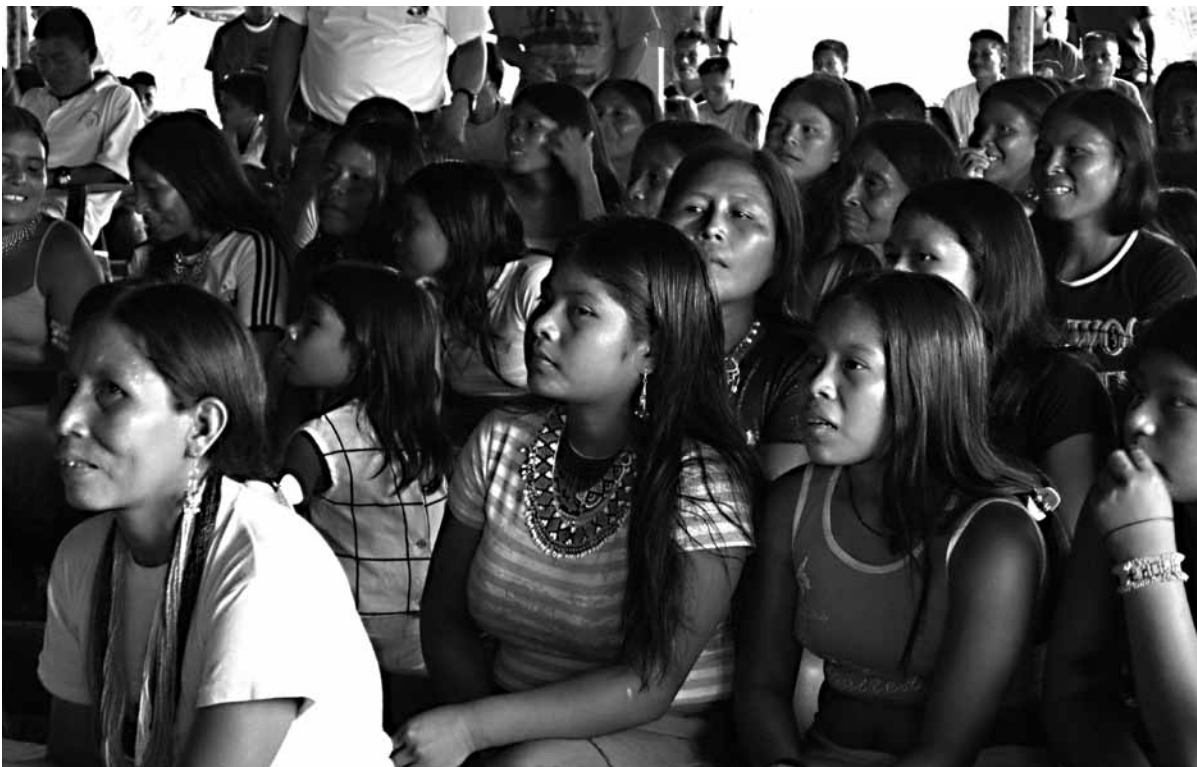
Urfolken i Chocó är välorganiserade och motsätter sig exploateringen av naturresurserna på sitt territorium.