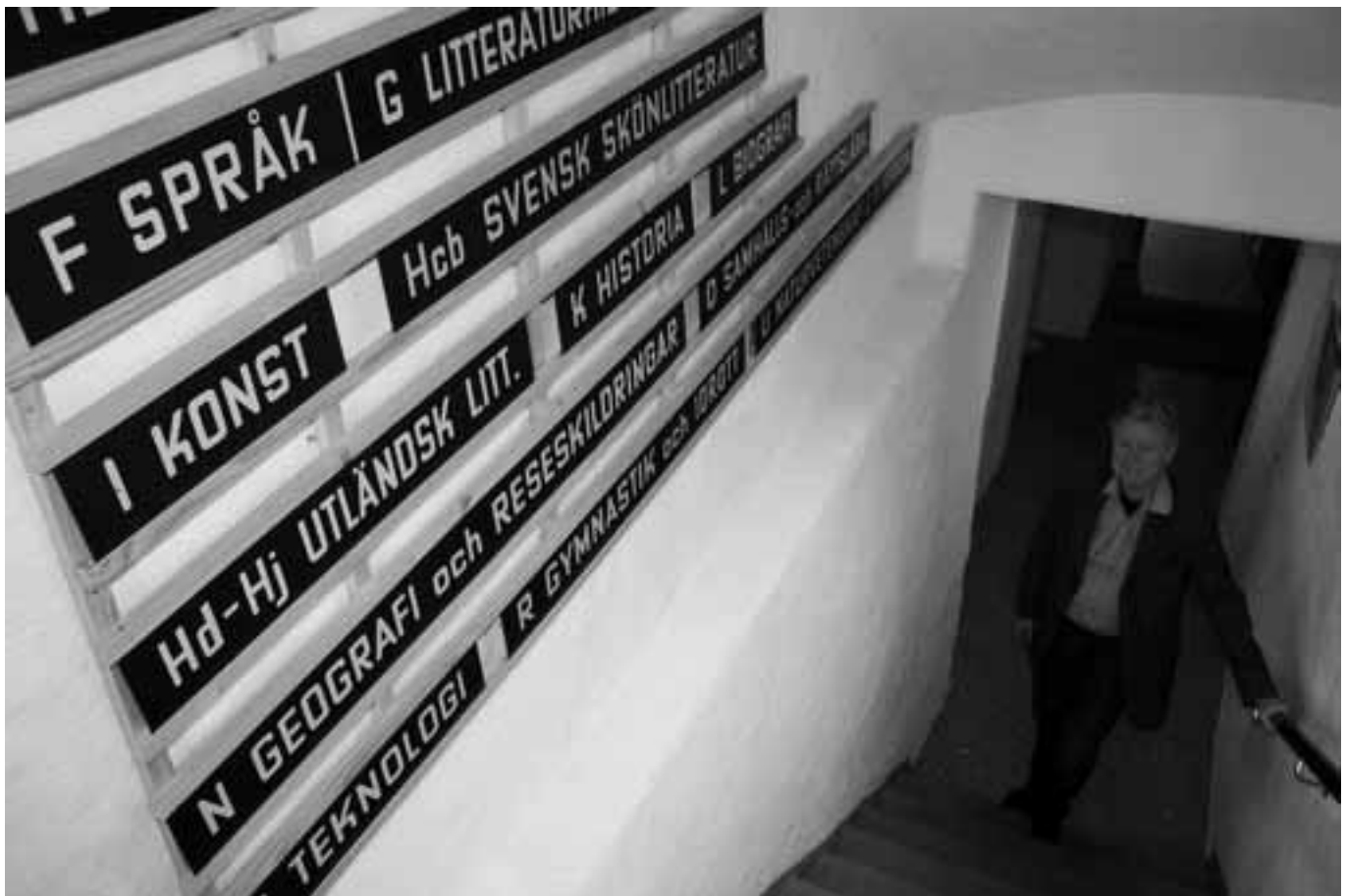
Trappan ner till Biblioteksmuséet. Tommy Olsson tar emot.