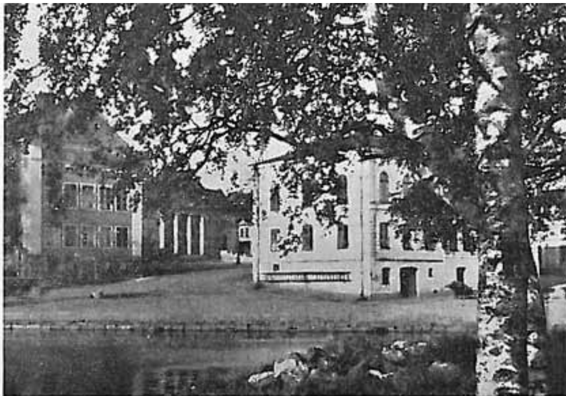
Härnösands gamla bibliotek. Den vita byggnaden t.h.

66 000 publika aktiviteter anordnades förra året. Sammanlagt gjorde vi 68 miljoner besök på folkbiblioteken.