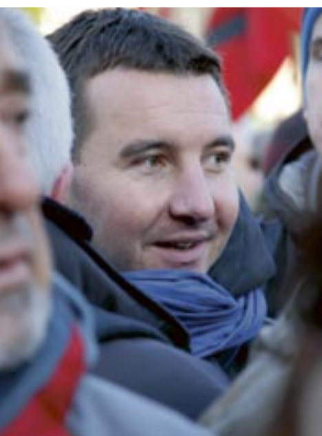
Änsterkändisarna Olivier Besancenot och Naomi Klein var i Köpenhamn.