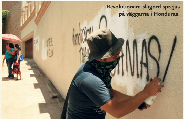
Revolutionära slagord sprejas på väggarna i Honduras.