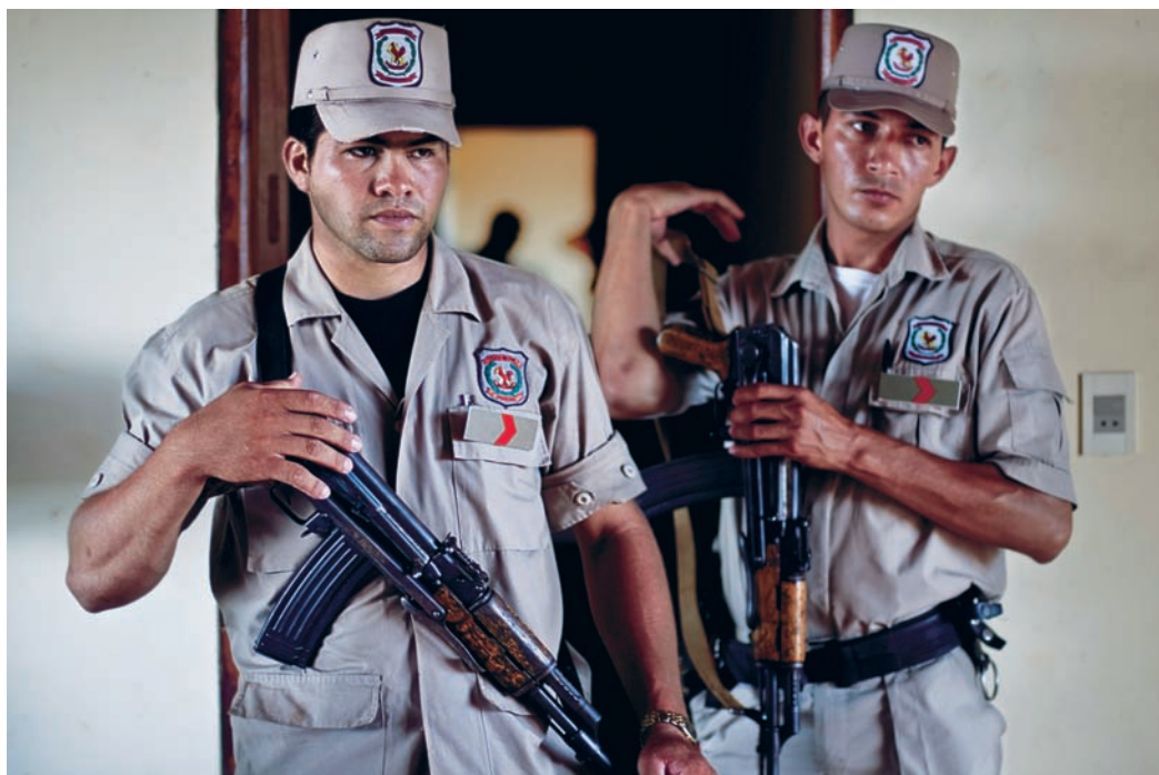
Paraguay räknas som ett av världens mest korrupta länder. Att polisen köps av storgodsägarna är inte ovanligt.

– Våra undersökningar visar att den småskaliga korruptionen har minskat, till exempel ber statligt anställda inte längre om en muta för att göra sitt jobb. Men i kongressen finns fortfarande mycket korruption och utfrågningar har visat att många fattiga sålde sina röster. I utbyte mot en vagn att samla sopor i fick till exempel partierna många fattiga stadsbors röster, säger Rivarola.