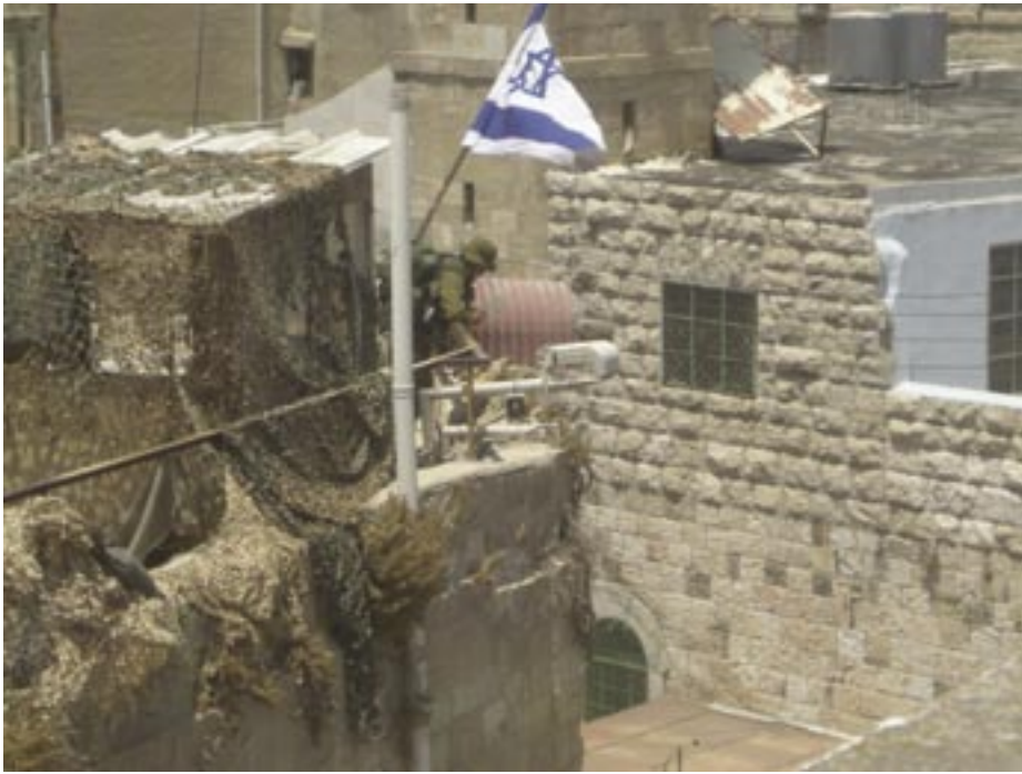
I hela det historiska Hebron har israelisk militär posteringar på taken.