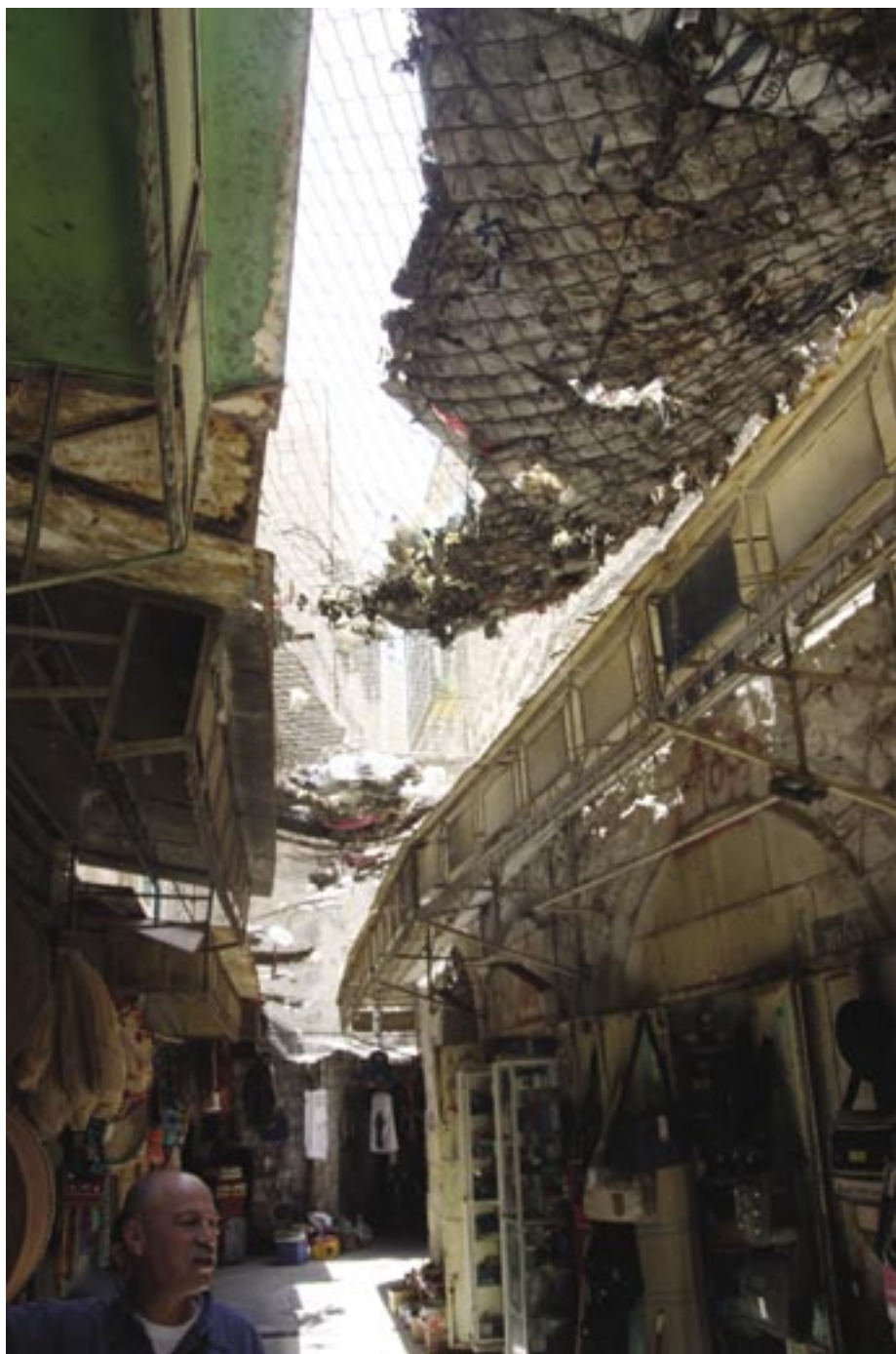
Bosättarna slänger regelmässigt ner sina sopor på basarernas nättak.