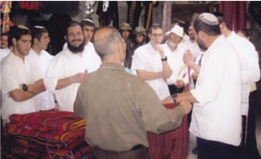
Bosättare från Kiriya Arba tittar roat på ett broderi över historiska Palestina (nedan t v.)