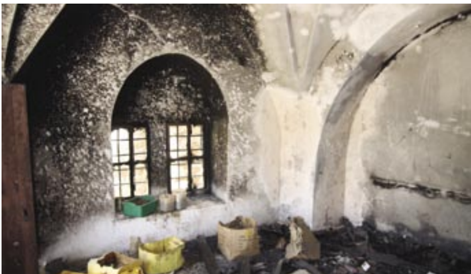
Rummet i familjen Aloweivis hus brändes ut med en molotovcocktail.