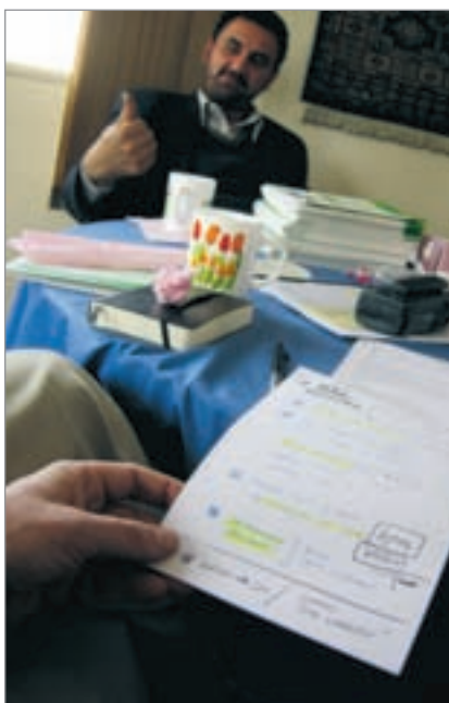
Säkerhetsmöte på huvudkontoret i Kabul.

”Olympia visar upp knivar med målat blod, en verklighetstrogen handgranat samt en kalashnikov med löstagbart magasin.