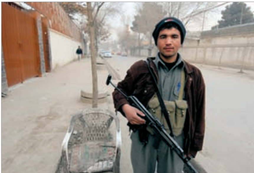
Checkpoints och säkerhetsstyrkor i Kabul efter attentatet.

19:30 Vaknar plötsligt i mörkret, och jag kan lova att det inte längre är några plusgrader!