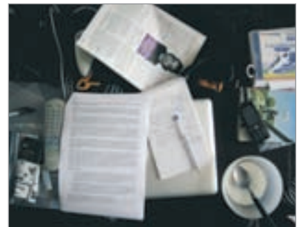
Planering inför Prag-konferansen.

21:30 ...står åter och svajar på en stol med mjölksyra i armarna. Tar en sista koll bland ANSOs säkerhetsuppdateringar innan det är dags att knoppa.