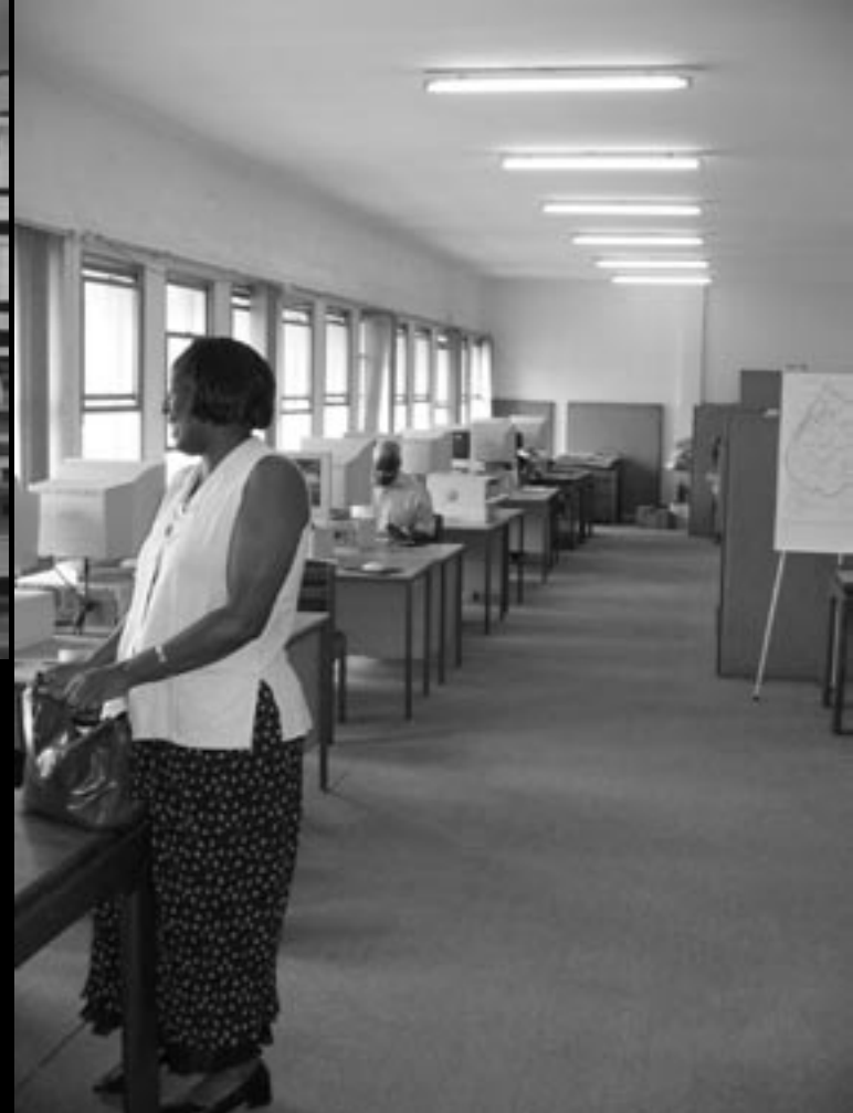
Interiörer från parlamentsbibliotekets PC-avdelning