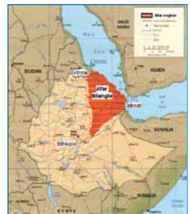
Afartriangeln i rött på kartan.

Sjukt afariskt flyktingbarn. Info från: info@afarfriends.org .