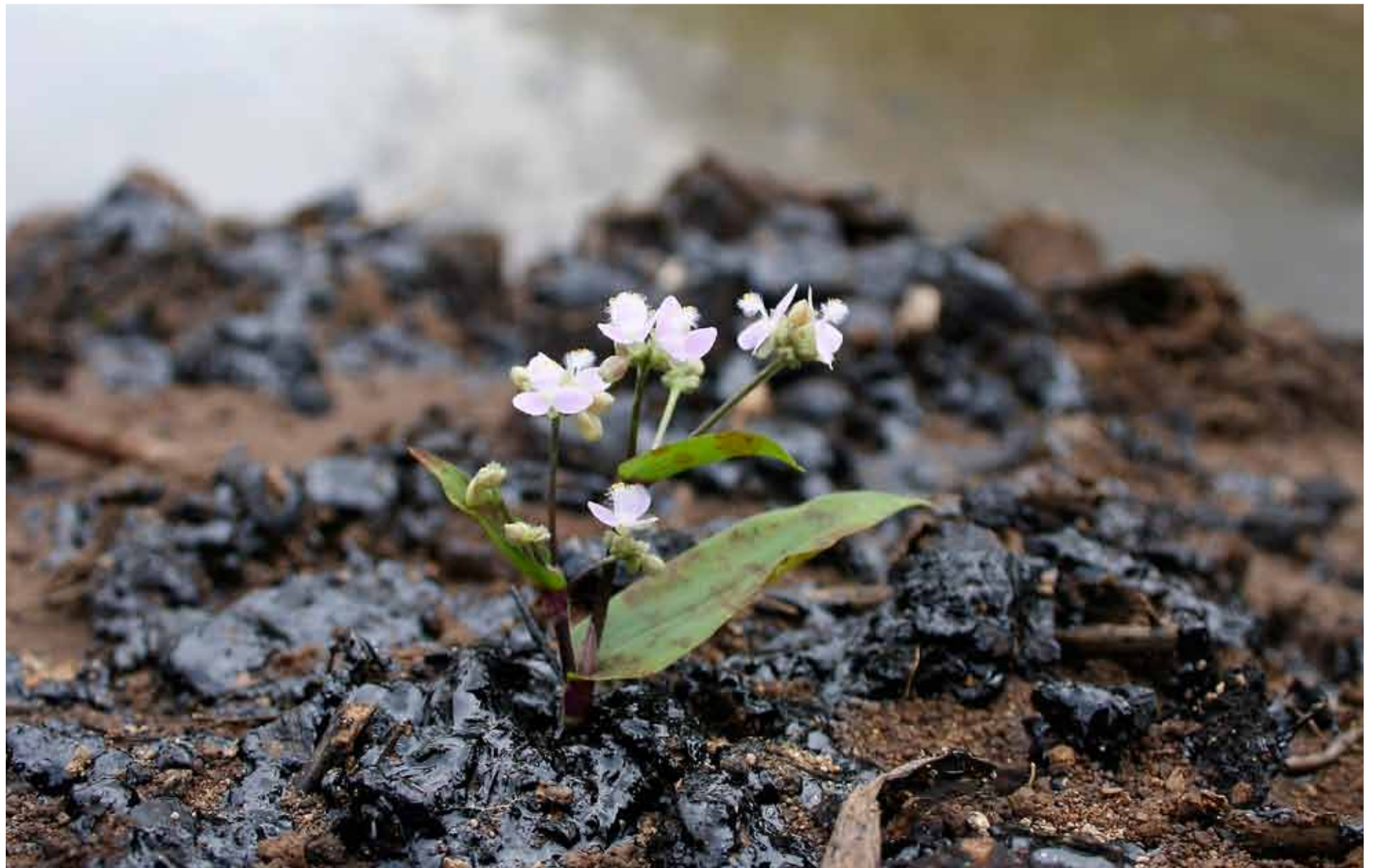
Texaco säger sig ha städad upp, men än idag finns spår av företagets verksamhet i form av öppna bassänger med oljeavfall.