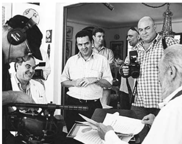
som ofta publiceras i kommunistpartiets tidning Granma eller på nätsidan Cubadebate. "Fidel måste vara en av mest välinformerade personerna i världen" sa hans vän Gabriel Garcia Márquez, den colombianske romanförfattaren, efter ett möte i fjol.