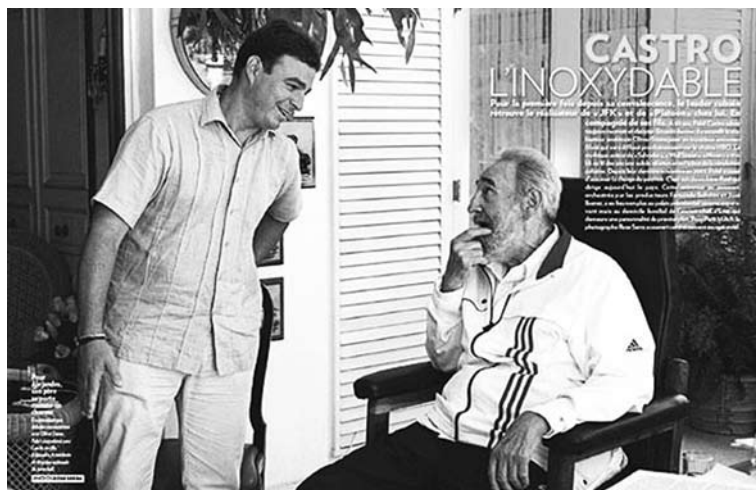
"Rostfri Castro. Den äldsta av revolutionärer visar Väst sitt mänskliga ansikte"

Castro skriver anteckningar i marginalerna, och uppslag till sina "betraktelser" över världshändelserna