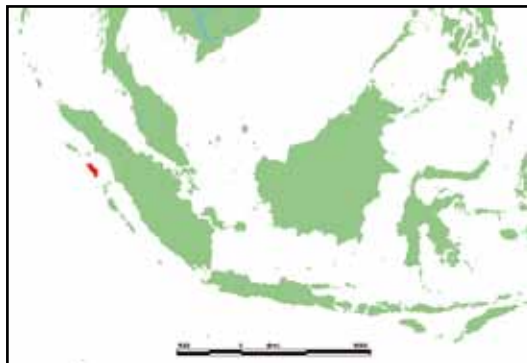
Nias i rött, väster om Sumatra.