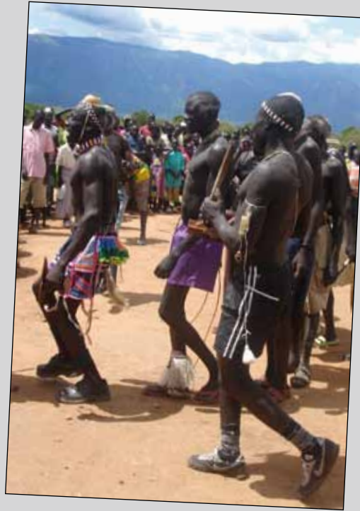
Unga män från Kapoeta, Eastern Equatoria, utför en traditionell fredsdans för att fira 2005 års fredsavtal mellan norra och södra Sudan.

det skulle vara möjligt att rösta, då de av naturliga skäl inte skulle befinna sig på samma ställe vid dessa båda tillfällen.