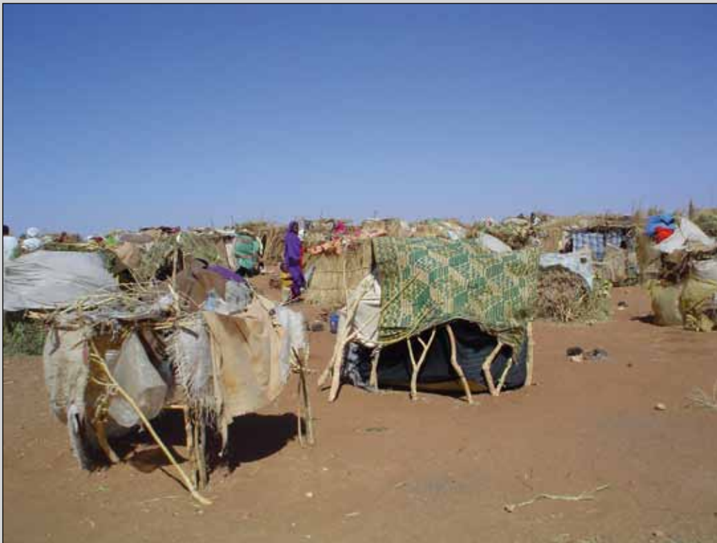
Läger för internflyktingar i Nyala i södra Darfur, Sudan.

Olja är en naturresurs som lätt leder till motsättningar om exempelvis tillgång till mark för utvinning och förvaltning av inkomster. Någon har kallat detta svarta guld för en "mixed blessing".