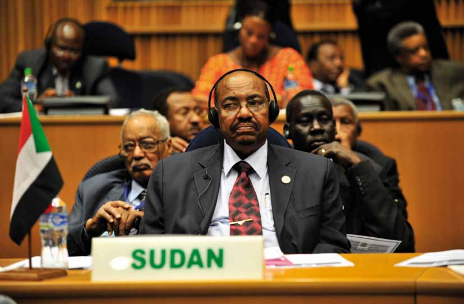
Omar al-Bashir, Sudans president, vid Afrikanska unionens möte i Addis Abeba, 31 januari 2009.