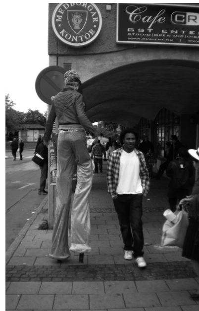
Bild från Inspiration Latinamerika i Rinkeby.

Sedan slutet av 2009 har vi börjat lägga ut Fjärde Världen-pressmeddelanden digitalt via MyNewsdesk. Tjänsten har som syfte att förse journalister med pressinformation. 4-500 nedladdningar per månad