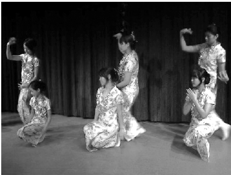
Bild från Thingyan den 18 april 2009, Etnografiska Museet.