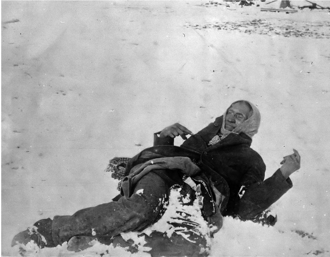
En mycket berömd bild som visar Big Foot/Spotted Elk död i snön vid Wounded Knee.

Foots grupp överlever. De sårade läggs på öppna vagnar och får efter många timmars väntan i kylan tak över huvudet i ett närbeläget missionshus.