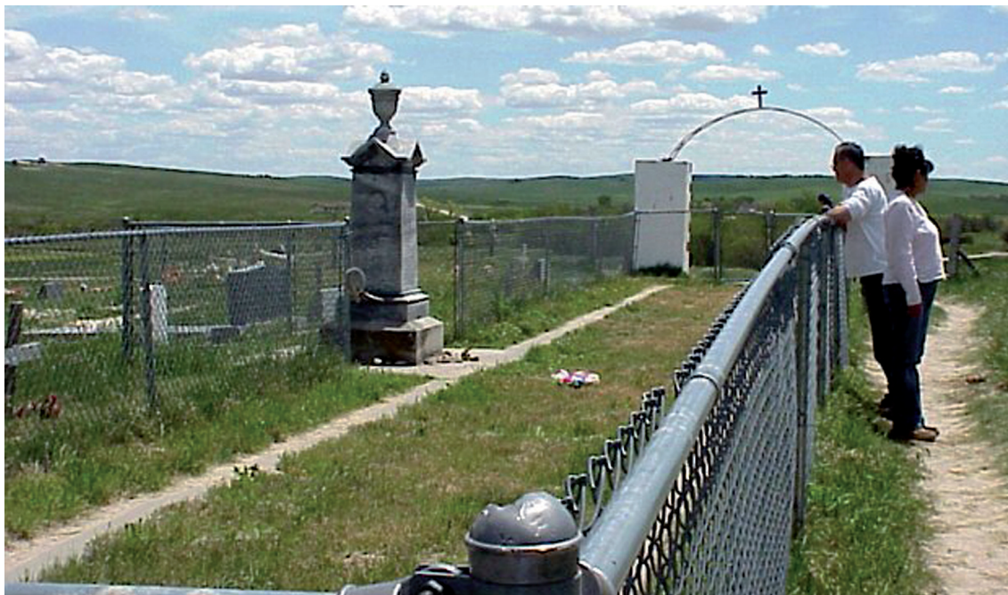
Massgraven vid platsen för Wounded Knee-massakern i South Dakota på Pine Ridge-reservatet. Foto: Phil Konstantin. Den här och de andra bilderna till denna artikel är från Wikimedia Commons