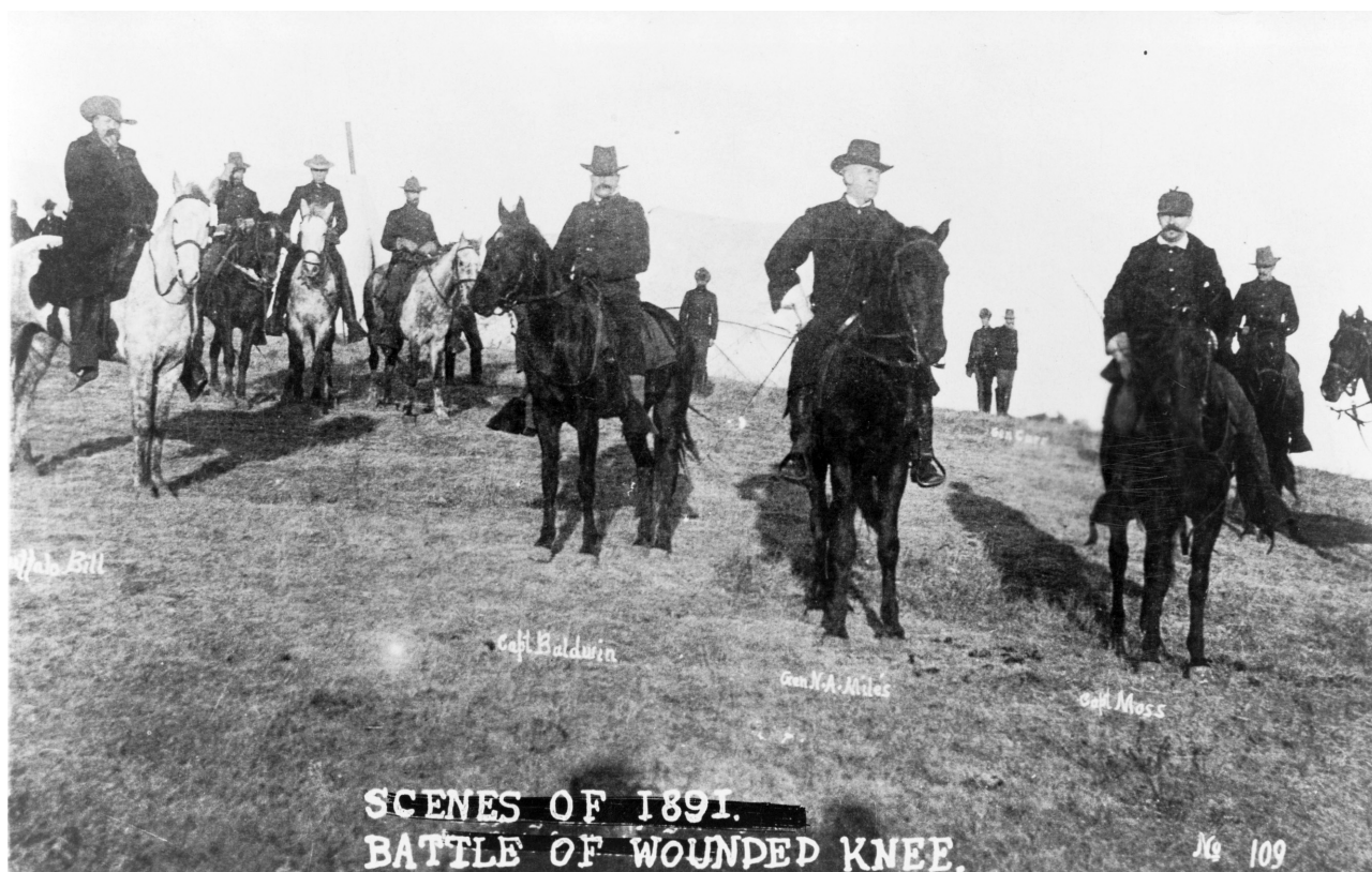
Officerare, Wounded Knee. Mannen längst till vänster anses vara Buffalo Bill.

dödades. En namnsamling med kravet att de 20 medaljerna återtas finns också.