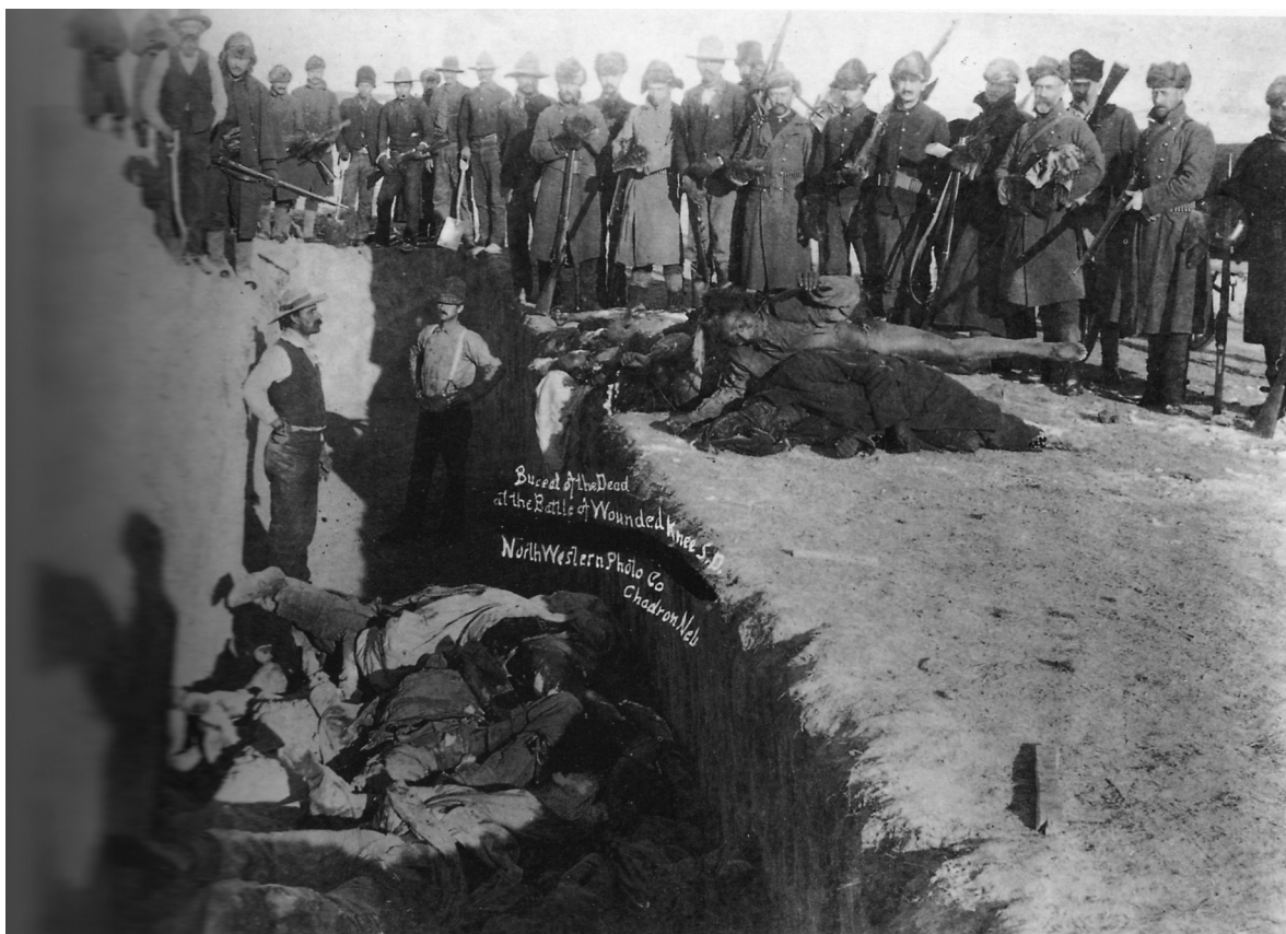
Begravning av de dödade indianerna, Wounded Knee.

Knee på Pine Ridge-reservatet i Syddakota. Där griper trupper från USA:s Sjunde kavalleriregemente Big Foot, lakota-ledaren som, sjuk i lunginflammation, lett indiangruppens vandring mot Badlands. Big Foot är inte hans verkliga namn, det är ett nedsättande namn som soldaterna hittat på. De 350 indianerna inringas.