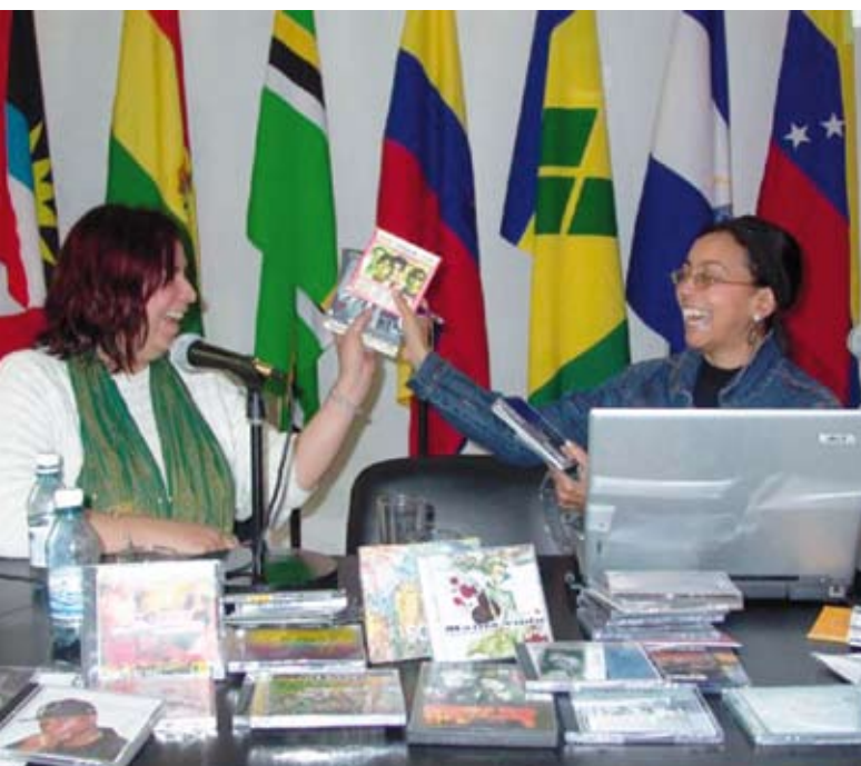
Ovan firas ALBA Cultural's första utgivning av musikalbum. Till höger ALBA's Kulturhus i Havanna invigdes 2009.

Redan när ALBA grundades fastslogs kulturens betydelse för denna nya form av integration mellan länder och folk. "De latinamerikanska och karibiska folkens kultur och identitet ska värnas, med särskild respekt och stöd till ursprungsfolkens kultur."