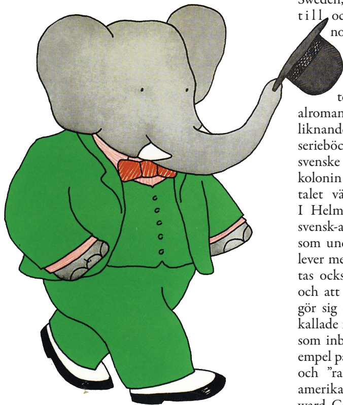
Babar, den klassiske barnboksfiguren, uppfostrades som "évolué", precis som den icke-vita eliten i franska kolonier.

Kid (1984), Den siste samurajen (2003) och Avatar (2009) och teveserier som BBC:s Tribal Wives (2008) och SVT:s Den stora resan (2009), och den litterära genre som handlar om att som vit kvinna vara gift med och få barn med en icke-vit man med titlar som Inte utan min dotter (1987), Gömda (1995) och Den vita massajen (1998) kan nämnas.