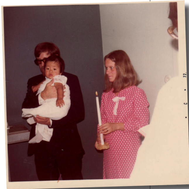
Författaren själv tillsammans med sina adoptivföräldrar i hemstaden Motala vid dennes dop i början av 1970-talet.

Forskare vid Mångkulturellt centrum och lärare vid Södertörns högskola