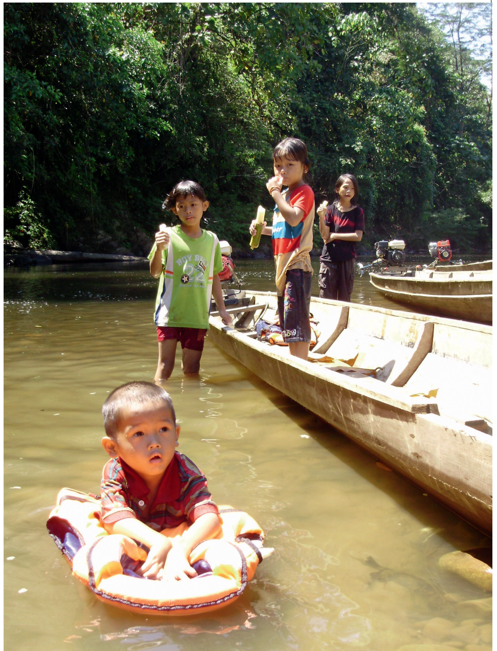
Med monsunregnen rinner leran från avverkningsområdena nu ut i floderna och smutsar ned vattnet. Flodfisken dör eller trängs bort.

som mals till mjöl, har idag i stor utsträckning ersatts av ris, då sagopalmerna blir allt färre.