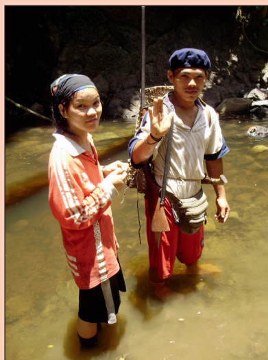
Ett ungt par på väg att korsa en flod. Penanerna går sällan ensamma och oövernade i skogen.