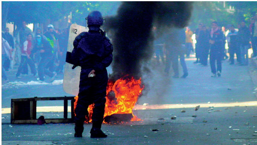
Demonstration mot höjda matpriser. Alger 7 januari 2011.

”Nu är det dags att äntligen trycka på för att respekten för grundläggande mänskliga rättigheter och slut på straffriheten i Algeriet i syfte att förhindra en upptrappning av våldet”, ansåg Delius.