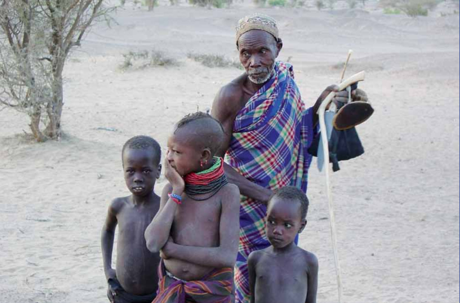
Turkana-man med barn. Turkanafolket lever i Turkana-distriktet i nordvästra Kenya, och vidare in i ett lika hett och torrt område i Uganda, Sudan och Etiopien.