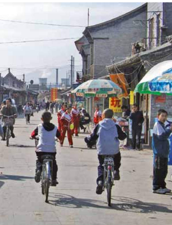
Ovan: gatubild från den äldsta stadsdelen i dagens Huhhot, huvudstad i Inre Mongoliet.

När jag var barn brukade mina föräldrar ibland ta med mig till Etnografiska Museet. Det låg på samma plats som idag, ute på Djurgården i Stockholm. Men ännu var museet inrymt i äldre gula byggnader, gamla militärkaserner. Där inne låg montrarna tätare än idag och var proppfulla med föremål. Lite dammigt, men spännande.