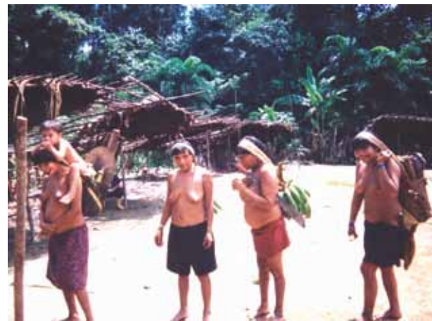
Yanomamikvinnor i delstaten Amazonas, Venezuela.

Bland det allra mest allvarliga som påstods i Tierneys bok var att Chagnon tillsammans med en annan forskare, genetikern James Neel ska ha injicerat mängder med yanomamis med ett tveksamt mässlingvaccin. Vaccinet ska ha varit av en typ som inte