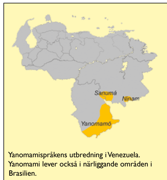
Yanomamispråkens utbredning i Venezuela. Yanomami lever också i närliggande områden i Brasilien.