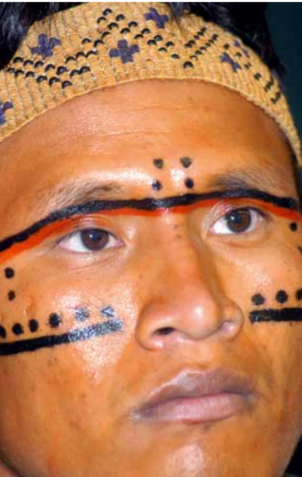
Yanomami från Brasilien.