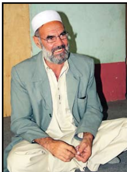
Skolföreståndaren hjälper till med översättningen.

skolan är jag lycklig, säger hon och illustrerar sina känslor med tydliga ansiktsuttryck. Det var en av Svenska Afghanistankommitténs anställda, som arbetar med uppsökande verksamhet, som besökte Khetayan i hennes by och berättade för hennes föräldrar att hon hade möjlighet att gå i skola i Taloqan. Här bor hon nära skolan hemma hos sin vuxna syster och hennes man.