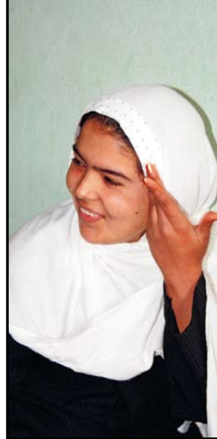
Khetayan lär sig teckenspråk på SAKs skola för människor med funktionsnedsättning i staden Taloqan. Hon är 14 år och går i första klass.