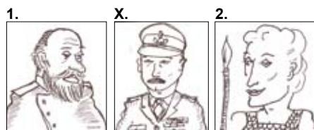
1. Alexander III Tsar av Ryssland X. Lord Alexander Brittisk general 2. Alexander den store Kung av Grekland

1. Vilken Alexander förknippas med Afghanistan? Under historiens gång har Afghanistan invaderats av främmande trupper vid flera tillfällen. En sådan invasion är förknippad med namnet Alexander. Vilken Alexander?