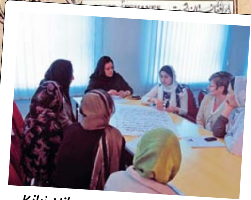
Kiki Nilsson Skarpnäcks Fria skola Sthlm