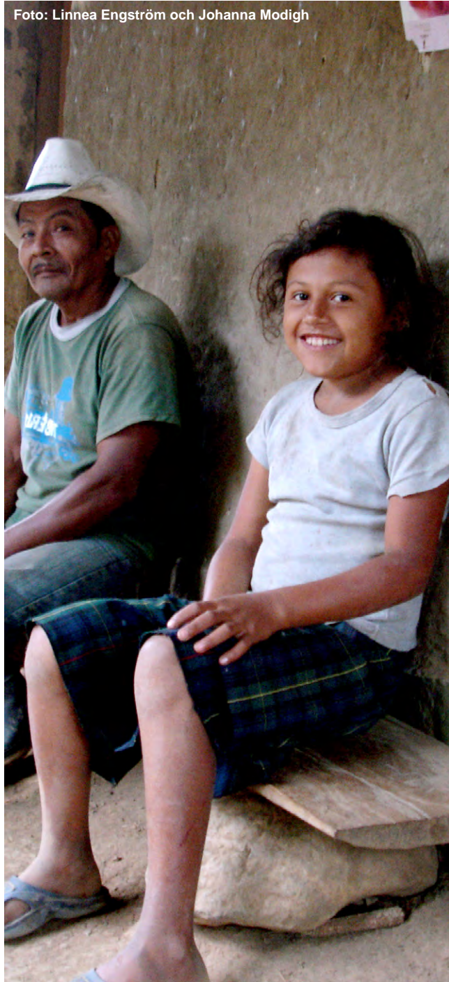
▲ Elvaåriga Nairobi jobbar på kaffeplantagen under sommarlovet för att finansiera sin skolgång.