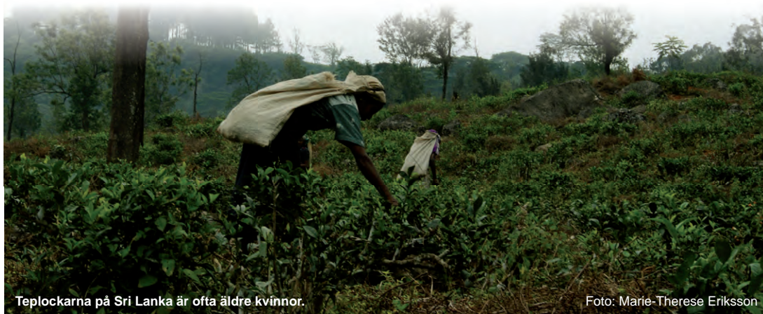
Teplockarna på Sri Lanka är ofta äldre kvinnor.