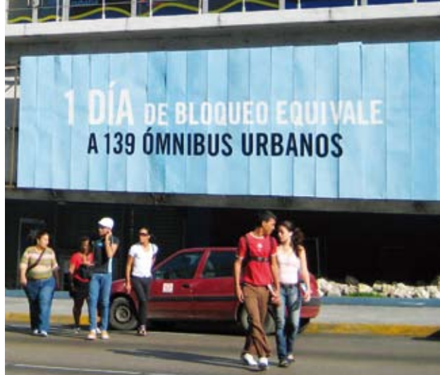
En dags blockad - 139 färre stadsbussar