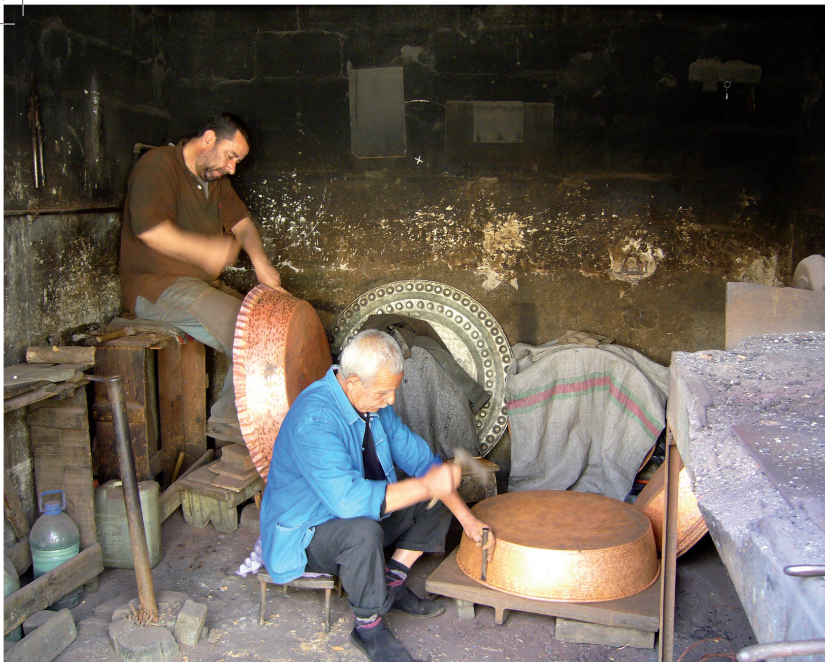
Kopparhantverkare i Constantine.

om Alger är Mohammed Dib. Född och uppvuxen i Bab Eloued, han känner till alla dess hemligheter. För det var i Alger allt hände. Det var i denna urgamla stad som våldet visade sitt allra värsta ansikte. Regeringen tvingades att spela alla sina kort och dess sista var just att svara med våld. Våld mot våld och folket fick betala priset.