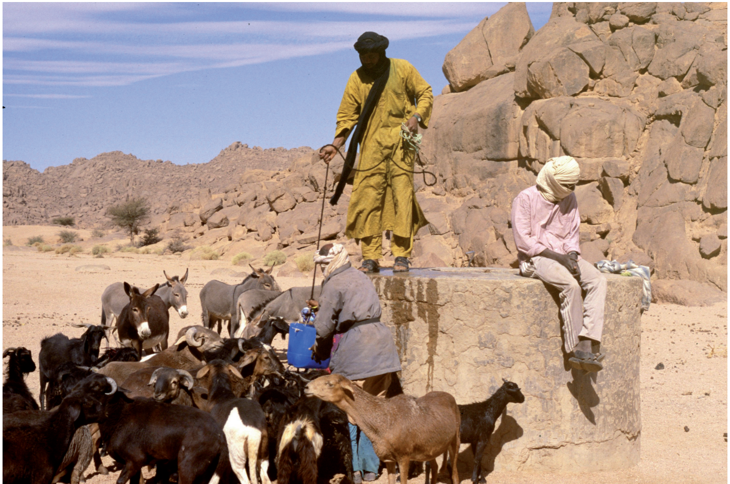
Tuareger i Algeriska Sahara.

ket kräver tusen gånger fler offer? Det skulle naturligtvis vara mycket enklare för oss om vi hade ert flygvapen. Om vi får era bombplan så får ni våra korgar!" (Dialog ur filmen "Slaget om Alger")