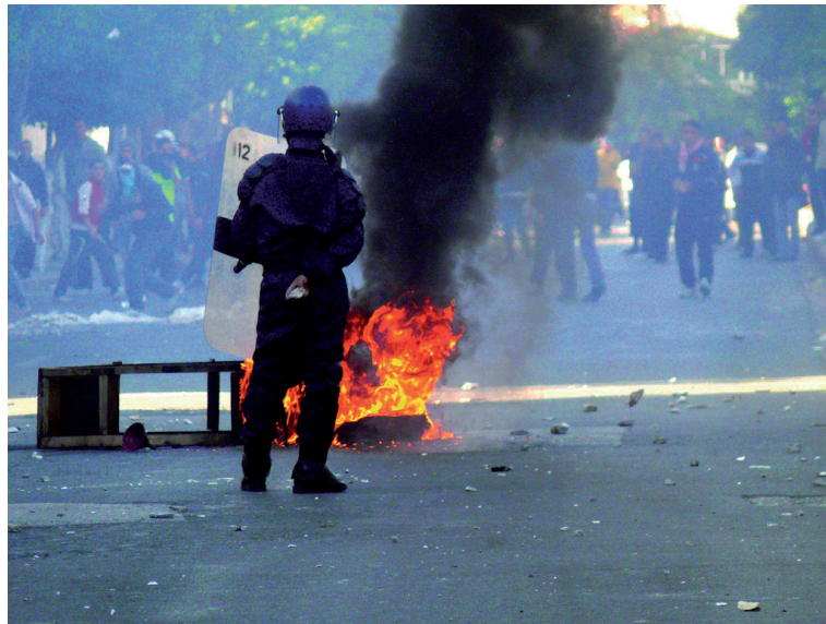
Upplopp på gatorna i Alger 2010

Men det regerande partiet som hade militärens stöd vägrade erkänna