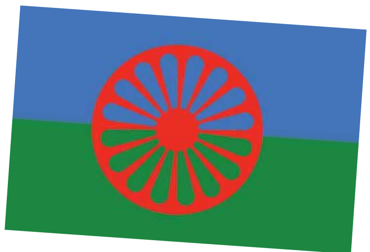
Alla romers flagga: hjulet mellan himlen och jorden.